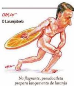
No flagrante, pseudoatleta prepara lançamento de laranja

Após ter dito que o país só teria vacina em 60 dias, o ministro da Saúde, Eduardo Pazuello, disse que, se algum fabricante "adiantar alguma entrega", a vacinação começará em "dezembro ou janeiro". A Pfizer, primeira a obter autorização de uso emergencial no Ocidente, disse que não consegue entregar doses antes de janeiro, já que outros países fecharam compras antes. Em resposta à lentidão do governo federal, governadores preparam vacinação nos estados, negociando imunizantes e insumos. No Rio, o governador em exercício, Cláudio Castro, criou grupo que terá três dias para apresentar plano e determinar compra de seringas e freezer. PÁGINAS 14 e 18