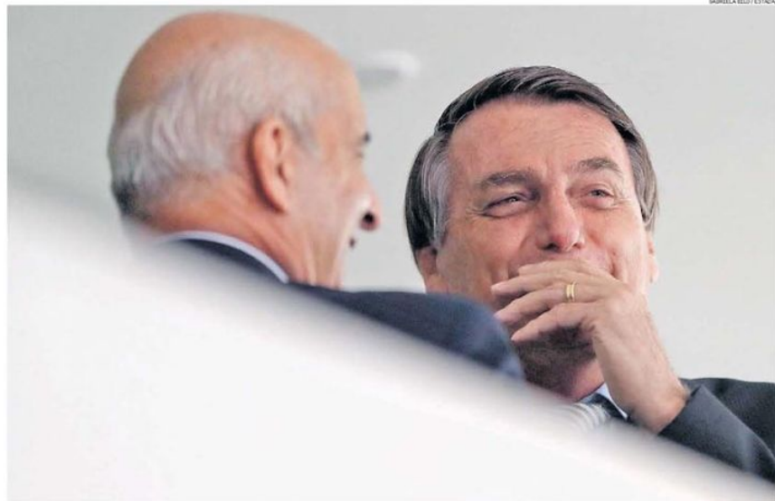
Proximidade. Luiz Eduardo Ramos com o presidente Jair Bolsonaro: general foi acusado por Marcelo Álvaro Antônio de fazer intrigas entre ministros

O Facebook tornou-se alvo de dois processos judiciais nos EUA, movidos pela Comissão Federal do Comércio e por uma coalizão de mais de 40 advogados-gerais estaduais. As ações acusam a empresa de abusar de seu poder e ferir leis de concorrência para criar um monopólio nas redes sociais, o que poderia obrigá-la a vender o Instagram e o WhatsApp. ECONOMIA / PÁG. B9