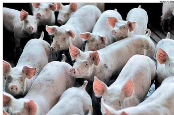
A suinocultura ganha força com a expansão do mercado internacional liderada pela China

Referência em eficiência no atendimento médico de Belo Horizonte, o Hospital Lifecenter foi vendido para a Notre Dame Intermédica, de São Paulo, por R$ 240 milhões. O pagamento, equivalente a R$ 1,2 milhão por leito, será realizado à vista, descontado o endividamento líquido e uma parcela retida para contingências. A transação depende da aprovação prévia do Cade. Com faturamento líquido de R$ 153,9 milhões registrado em 2019, o Lifecenter opera com 205 leitos, sendo 40 de UTI, 13 salas cirúrgicas e 12 consultórios de pronto-socorro. Pág. 9