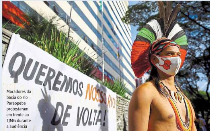
Moradores da bacia do rio Paraopeba protestaram em frente ao TJMG durante a audiência