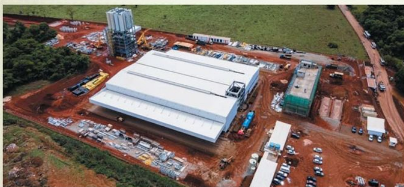
DESENVOLVIMENTO - Fábrica de argamassa e material de construção em Matozinhos: incentivo para produzir e gerar emprego