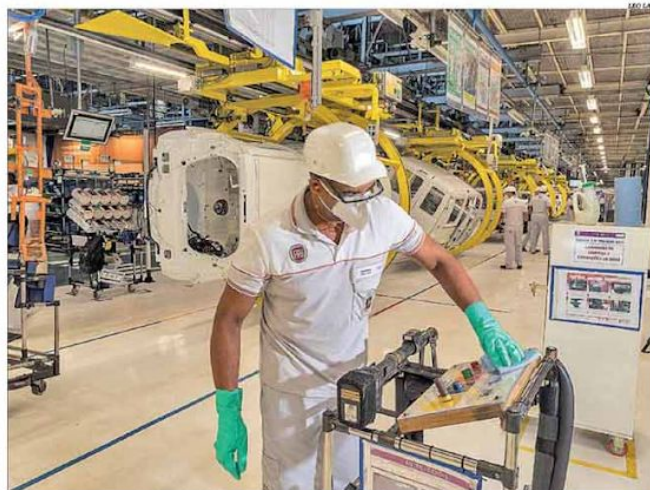
Com crescimento de 44,1%, a fabricação de veículos automotores, reboques e carrocerias foi destaque em MG

Em outubro no confronto com o mesmo mês de 2019, nove das 13 atividades pesquisadas pela entidade tiveram incremento em Minas. O principal destaque foi a fabricação de veículos automotores, reboques e carrocerias (44,1%), seguida por produtos têxteis (22,8%) e fabricação de coque, de produtos derivados do petróleo e de biocombustíveis (17,5%). As maiores quedas ocorreram nas indústrias extrativas (-16,7%), fabricação de outros produtos químicos (-16,6%) e metalurgia (-9,6%). Pág. 3