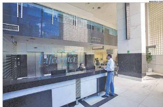
O Hospital Lifecenter tem 205 leitos, 13 salas cirúrgicas e 12 consultórios de pronto-socorro