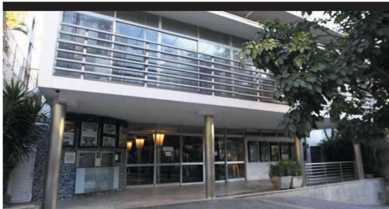
AJUADA - Cinema Belas Artes foi um dos contemplados; dinheiro deve ser usado para cobrir despesas de manutenção, como luz