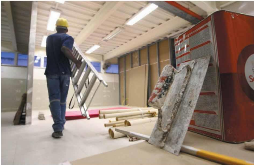
"CESTA BÁSICA" - Presidente do Sinduscon diz que aumento dos preços dos materiais foi abusivo: cimento subiu 40% de janeiro a agosto; aço, 20%; PVC, 15%

Demanda aquecida na pandemia encarece o cimento ao PVC, fazendo inflação da construção civil atingir maior percentual mensal desde março de 2014. Resultado: novos imóveis, até do Minha Casa, Minha Vida, devem encarecer. PRIMEIRO PLANO - P.2