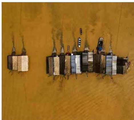
Balsas de garimpo legal no rio Madeira, em Humaitá, a 700 km de Manaus.

Estável Rio de Janeiro (RJ) Brasília (DF) Belém (PA) Guarulhos (SP) Dados dia 20h de 9 set *Média móvel de 7 dias **Em relação a 14 dias