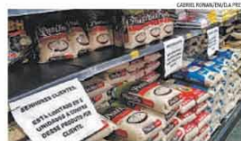
COMPRANDO ARROZ EM UM SUPERMERCADO.

Para tentar segurar a disparada de preços de componentes da cesta básica, o governo anunciou a redução a zero da alíquota do Imposto de Importação de arroz em casca e beneficiado até 31 de dezembro. A medida foi adotada depois de a ministra da Agricultura, Tereza Cristina, e o próprio presidente Jair Bolsonaro terem descartado qualquer intervenção para evitar aumentos. Já o Ministério da Justiça notificou supermercados e cooperativas de produtores de alimentos básicos para explicarem, em cinco dias, os altos reajustes adotados depois do início da pandemia. Em BH, grandes redes de supermercados limitaram a compra de arroz a cinco pacotes de 5 quilos por cliente. (2)