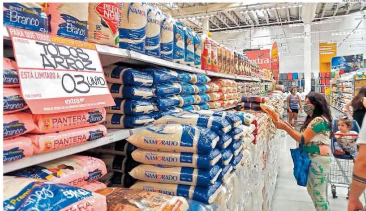
Compras limitadas. Em SP, supermercado estabelece limite aos consumidores para compra de arroz; alta do produto no ano é de 19,25%

Questionamento ocorre após Bolsonaro pedir lucro 'próximo de zero' a supermercados; setor fala em alta do consumo