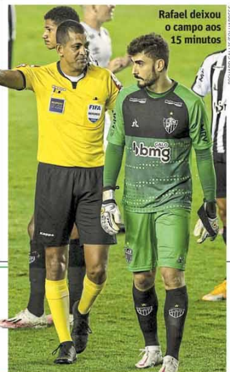
Rafael deixou o campo aos 15 minutos

Falhas de Victor e Rafael, que foi expulso, foram decisivas na derrota por 3 a 1 para o Santos. Sampaoli está suspenso. Página 26