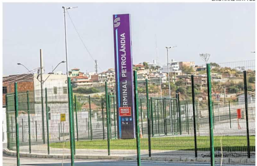
■ Passageiros alegam falta de informação prévia sobre o fechamento do terminal

A Transcon disse que vai entregar folhetos informativos, afixar faixas nas principais vias da região do Petrolândia e pontos finais das linhas e fazer publicações nas redes sociais. Entretanto, a reportagem não encontrou nenhum informativo no local.