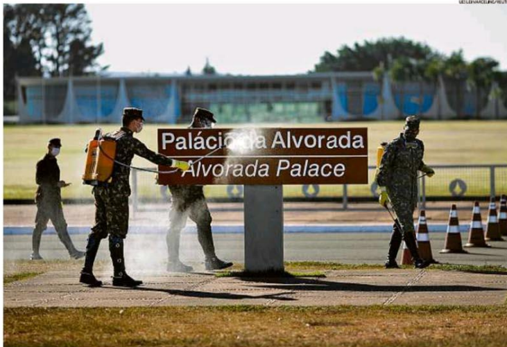
Desinfecção. Mil itares aplicam produtos químicos contra o coronavírus na entrada do Palácio da Alvorada, onde o presidente Jair Bolsonaro recebe tratamento para a Covid-19

RIO DE JANEIRO, SEXTA-FEIRA, 10 DE JULHO DE 2020 ANO XCV - Nº 31.345 - PREÇO DESTE EXEMPLAR NO RJ - R$ 5,00 2ª EDIÇÃO