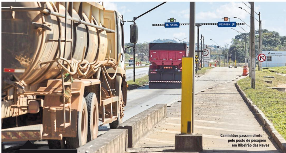
Caminhões passam direto pelo posto de pesagem em Ribeirão das Neves

■ Nem o aumento de 600% no número de leitos para Covid-19 desde o início da pandemia, nem as 34 novas vagas abertas nas últimas 24 horas foram suficientes para aliviar a ocupação: ontem, Belo Horizonte tinha pacientes com a doença em 92% dos leitos de UTI e 76% dos de enfermaria. Pelos critérios do município, os percentuais acima de 70% indicam alerta vermelho. Terceiro parâmetro, a taxa de transmissão do vírus está no limite tolerável: 1,20. Diante disso, a paralisação das atividades continua. Página 6