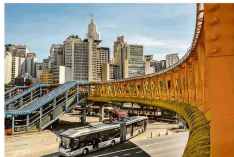
Ônibus saem do terminal Parque Dom Pedro 2º, no centro de São Paulo

WhatsApp desativa contas do PT por disparos em massa A7