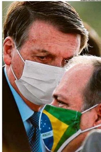
Recuo. Bo cenário com Pazuello: soma das mortes voltou ao site do Ministério da Saúde

Após determinação do Supremo Tribunal Federal (STF), e sob pressão do Congresso e da comunidade científica, o governo voltou ontem a publicar os dados completos da Covid-19. O ministro interino da Saúde, Eduardo Pazuello, disse que os dados são "inescondíveis". A Organização Mundial da Saúde (OMS) recuou de declaração da véspera e esclareceu que há, sim, registros de transmissão de Covid-19 por pessoas sem sintomas. PÁGINAS 9-10