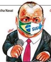
— Resumindo nossa batalha contra o coronavírus... tiro n'água!