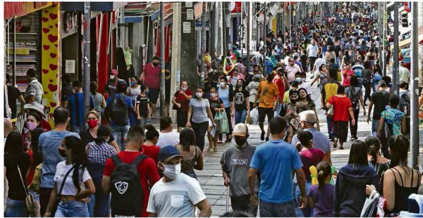
Centro de Campinas, no interior de São Paulo, depois de a prefeitura flexibilizar a quarentena e permitir a reabertura do comércio Reportagem: Capela/Jacir/Protagonist

Assintomáticos também transmitem coronavírus, disse ontem a líder técnica da OMS, para esclarecer fala da véspera que teria levado à interpretação oposta. Jair Bolsonaro usou a declaração anterior para defender a flexibilização das quarentenas. saúde B4