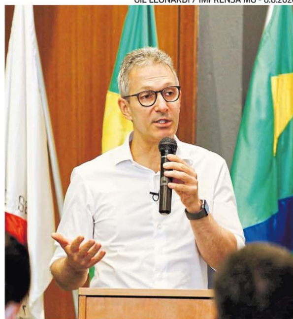
GIL LEONARDI / IMPRENSA MG - 8.6.2020

Zema afirmou que a quitação do salário de todo o funcionalismo é prioridade para ele e que o pagamento só vai ser