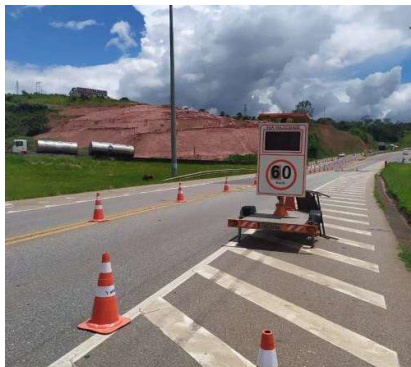
Redação CSul – Iago Almeida

Depois que uma cratera se abriu no trevo da Fernão Dias, no km 264 da BR-491, entre Varginha e Três Corações, motoristas estão tendo que desviar suas rotas quando pretendem entrar em Varginha. Uma forte depressão foi causada no local, provocando solavancos nos veículos, o que poderia vir a causar acidentes.