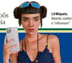
Lil Miquela. Modelo, cantora e "influencer"

SEGUNDO EM QUARENTENA Com humanos acudados, robôs ganham espaço na pandemia