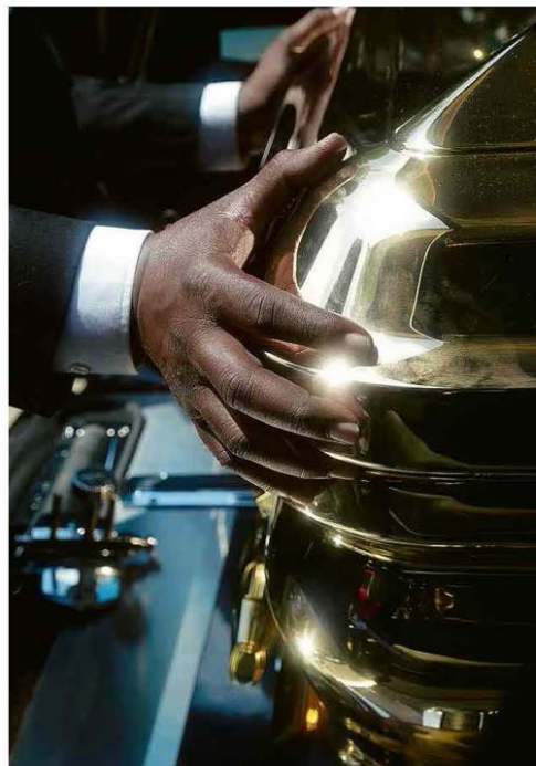
Caixão com o corpo de George Floyd após o funeral em Houston, nos EUA

AUDIÊNCIA/MÊS PÁGINAS VISTAS 340.339.921 VISITANTES ÚNICOS 54.958.699