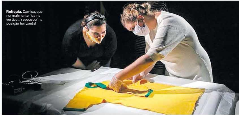
Relíquia. Camisa, que normalmente fica na vertical, 'repousou' na posição horizontal.