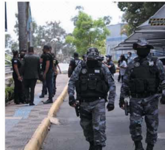
ATRAS DAS GRADES - Foram cumpridos 29 mandados de prisão preventiva