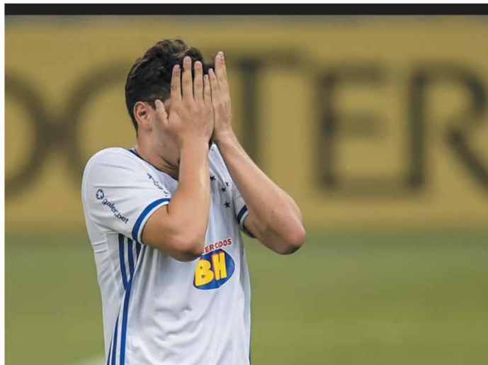
GOLPE DUPLO Foram dois baques de uma só vez: no mesmo dia em que saiu do Profut, o que pode estrangular de vez o caixa celeste, o Cruzeiro ainda perdeu de 2 a 1 para o Sampaio, mantendo-se no Z4 da Série B. ESPORTES - P.13