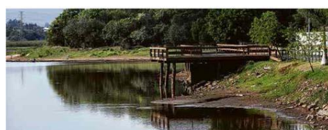
Represa do Ferraz, na cidade de Sorocaba (SP), está com nível crítico de água.

Saúde B4 Em livro, Schwarcz e Starling falam da gripe espanhola e ecoam a Covid-19