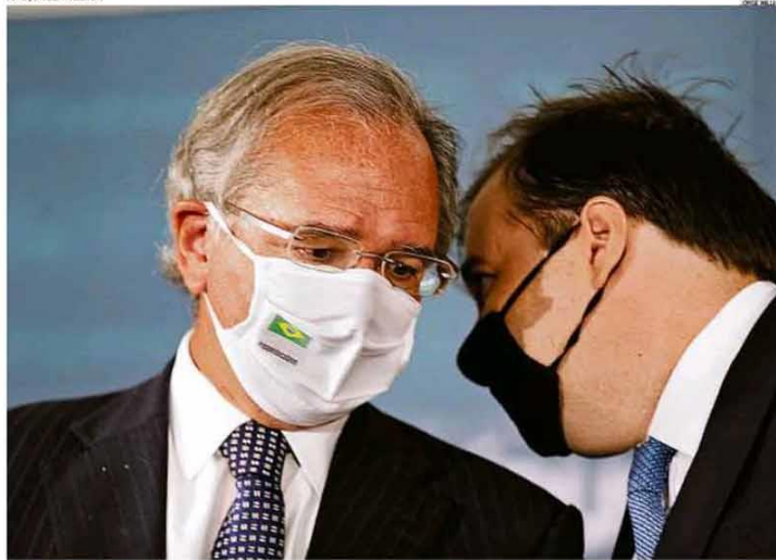
Com a presença do ministro Paulo Guedes (Economia) e do presidente da Câmara, Rodrigo Maia, frente parlamentar apresentou uma série de propostas para a reforma administrativa. O grupo quer que o pacote de mudanças atinja também os atuais servidores públicos, bem como juízes, promotores e procuradores do Ministério Público. PÁGINA 23