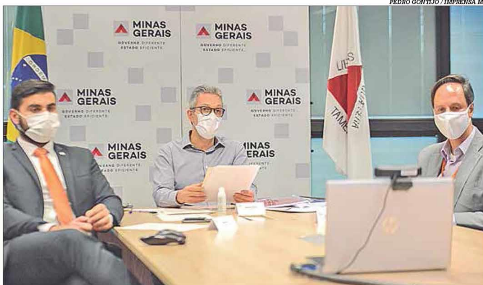
Governador de Minas apresentou um balanço de ações no enfrentamento ao Covid-19

Usados em pacientes graves, novos respiradores serão entregues nos próximos dias em todo o Estado. Ao todo, o governo adquiriu 1.047 respiradores, resultado