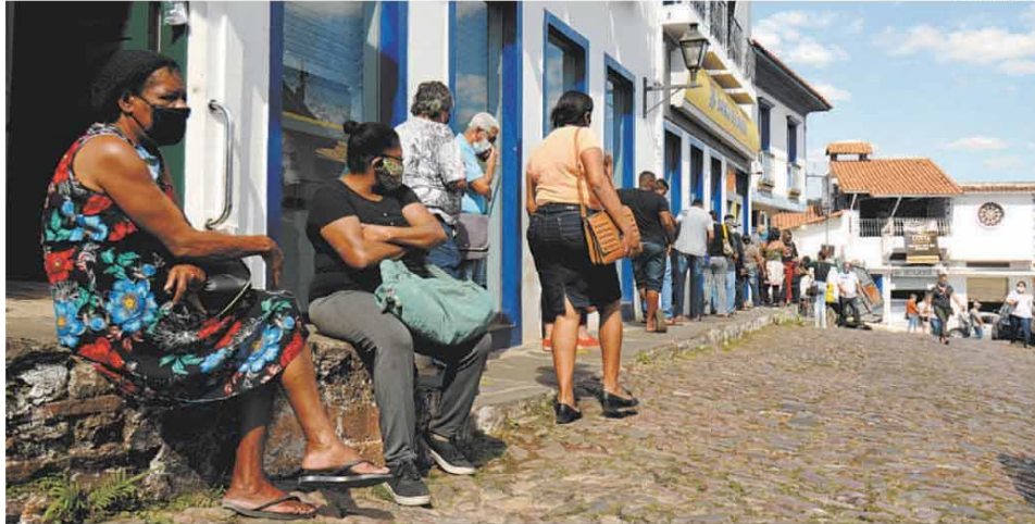
Sabará lidera a lista de cidades que mais fizeram pedidos de leito. Prefeitura conseguiu cadastrar vagas da Santa Casa municipal no SUS, o que deve reduzir a necessidade de transferência para BH