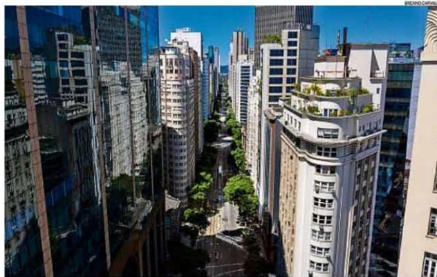
PÁGINA 11 Metamorfose urbana. A transformação de imóveis comerciais em moradia é apontada como solução para evitar o esvaziamento da região central

Com empresas adotando o home office, o Centro do Rio tem o desafio de se reinventar após a pandemia, quando mais da metade de seus imóveis pode ficar desocupada. Aposta em residenciais deve ser a saída.