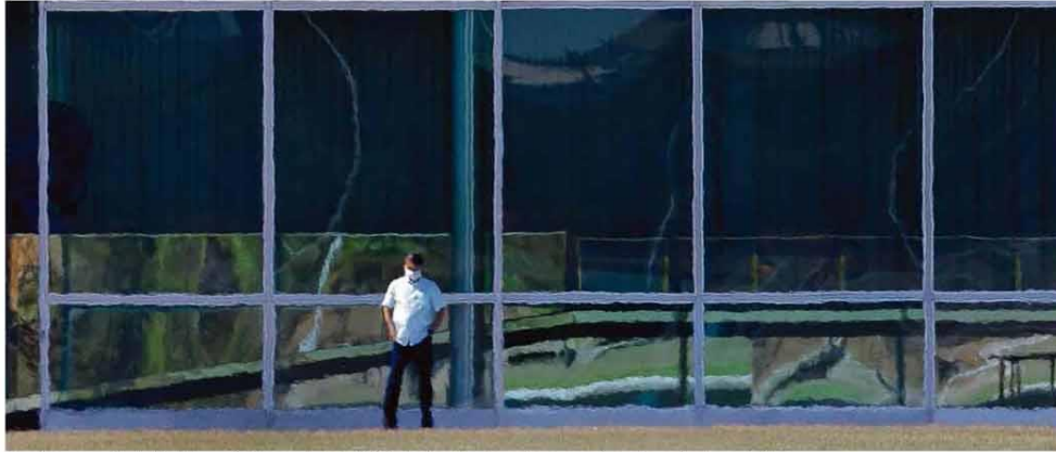
De máscara, o presidente Jair Bolsonaro é visto na entrada do Palácio da Alvorada ontem pela manhã, após ser diagnosticado com Covid-19.