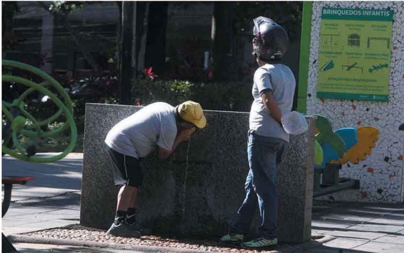
COMO ANTES – Embora autoridades de saúde reforcem pedido para que as pessoas fiquem em casa, vários belo-horizontinos mantêm rotina de exercícios em locais públicos e há até quem use bebedouros em plena pandemia