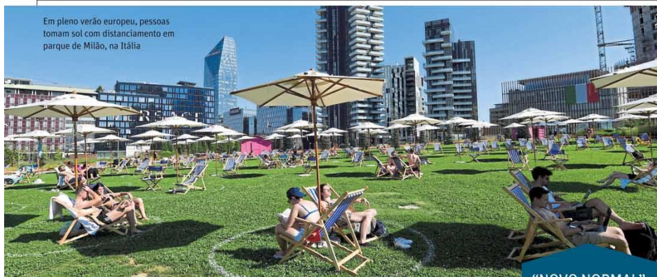
Em pleno verão europeu, pessoas tomam sol com distanciamento em parque de Milão, na Itália

■ O governo do Estado esperava a votação das alterações no sistema de aposentadorias até 31 de julho, mas a tramitação do processo será suspensa para que haja debate. Página 3