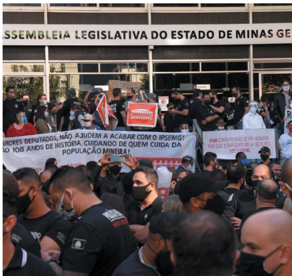
PROTESTO — Na manhã de ontem, dezenas de servidores estaduais fizeram manifestação na porta da ALMG, pedindo a rejeição da reforma