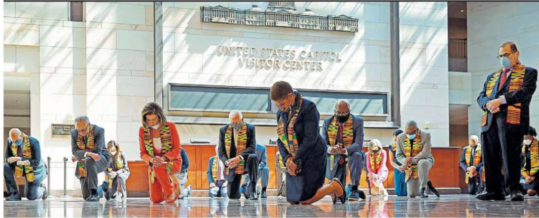
EUA DEBATEM MUDAR A POLÍCIA Usando cachecol de kente, tecido tradicional africano, congressistas dos EUA prestam homenagem a George Floyd, no dia em que o homem negro morto por policial foi sepultado; Congresso discutirá reforma na polícia. Proposta democrata inclui rastreamento e julgamento rápido de agentes violentos. INTERNACIONAL / PÁG. A7