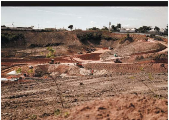
SEM FOLGA Obras na Arena MRV, o novo estádio do Galo, entram no 50º dia; “tour” no canteiro teve que ser adiado devido à pandemia. ESPORTES—P.11