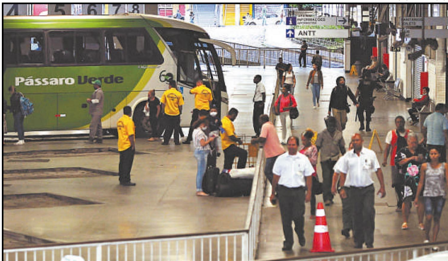
Movimento na rodoviária de BH no início da pandemia: governo do estado quer definir novas regras para o transporte coletivo dentro do estado

CAUTELA Ele ressalta que está mantida a previsão do pico da COVID-19 para dia 15 de julho, mas que isso pode mudar. “Vamos aguardar a reabertura de setores para saber como a pandemia vai se comportar. Estamos preparados, através da Fhemig, para atender. Novamente digo que é preciso que todos tenham cuidado, fiquem em casa e, quando saírem, usem máscara o tempo todo”, reforçou.