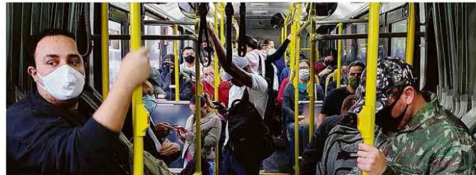
Passageiros viajam em pé em ônibus que partiu ontem do Terminal Grajaú, na zona sul de São Paulo.

O 1º dia da determinação da prefeitura para que ônibus vivissem sem passageiros em pé, para evitar aglomeração, teve lotação. Bruno Covas (PSDB) ameaçou demitir o secretário de transportes caso não haja cumprimento. Saúde B4