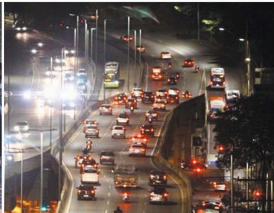
VELHO NORMAL? — Movimento de pessoas foi intenso especialmente no Centro da capital; cena da hora do rush também foi “familiar”, nos principais corredores viários da capital