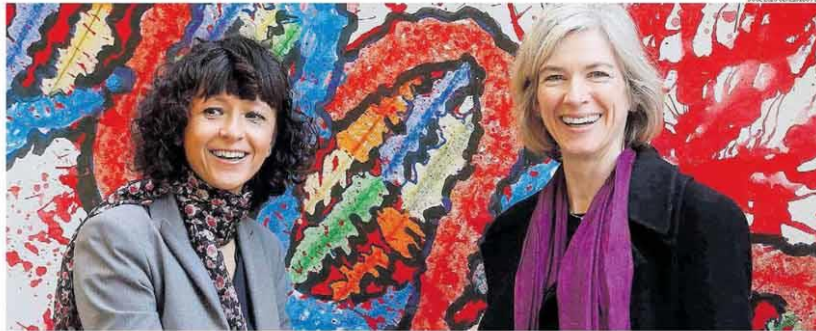
Lauréadas em Química. Emmanuelle Charpentier e Jennifer Doudna foram premiadas pela criação de uma ferramenta para edição do genoma