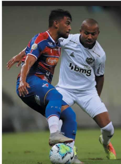
DERROTA Atlético jogou mal e perdeu de 2 a 1 para o Fortaleza, ontem, no Castelão. ESPORTES - P. 13