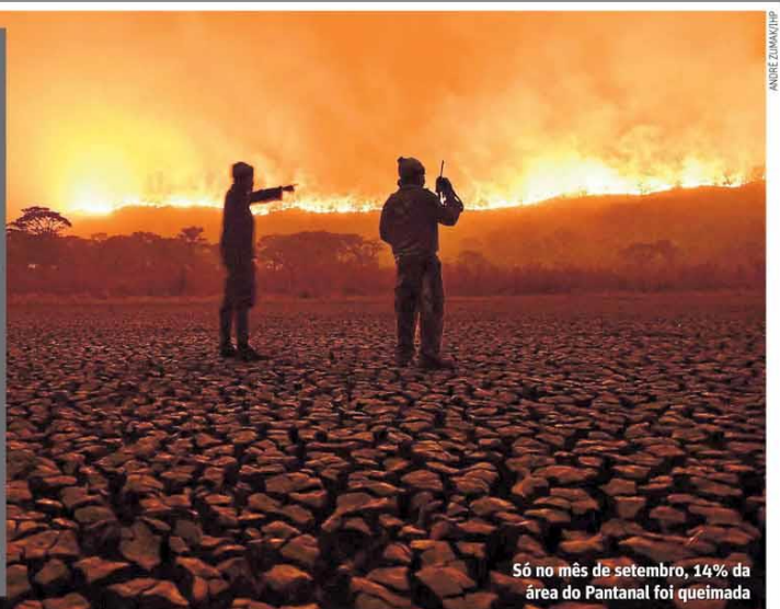
Só no mês de setembro, 14% da área do Pantanal foi queimada