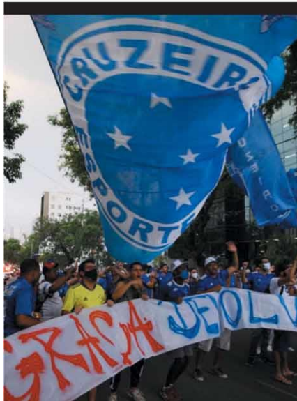
PRESSÃO Torcida cruzeirense protesta pelo momento ruim do time na Série B. ESPORTES - P. 14