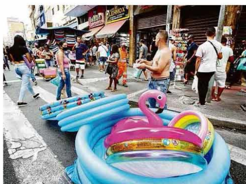
Comerciante vende piscinas de plástico na rua 25 de Março, em São Paulo.

A 27 dias da eleição, Donald Trump precisará de reviravolta inédita no país para se reeleger. Nunca um candidato em desvantagem tão grande tão perto do pleito foi eleito. A14