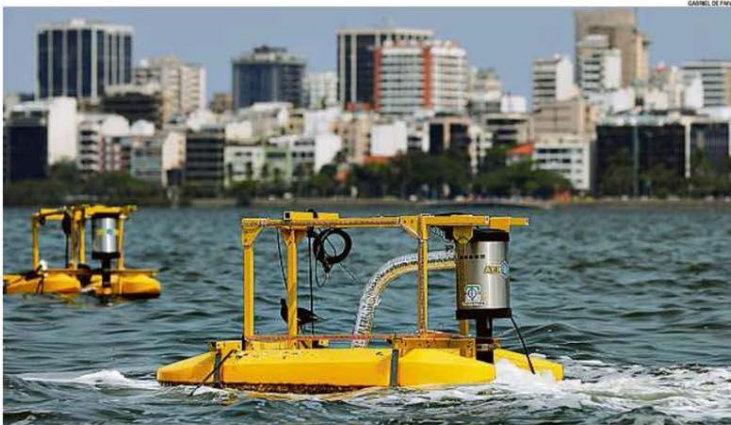
Em fase experimental, três plataformas perto do Clube Pirajá ajudam a oxigenar a poluída Lagoa Rodrigo de Freitas. Se a medida der resultado, os aeradores serão colocados em outros pontos do espelho d'água. Especialistas avaliam que aparelho ataca os sintomas, mas não a causa do problema, que é o despejo de esgoto. PÁGINA 17