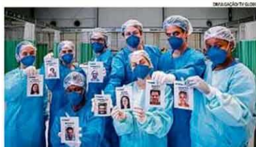
Equipe. Atores de "Sob pressão: Plantão Covid" em hosp ta de campanha cenográfica