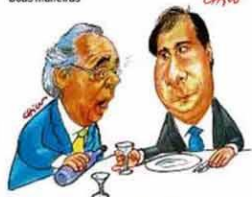
— Aceita estricnina?