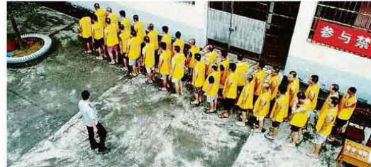
26 Jun. 19/17/19