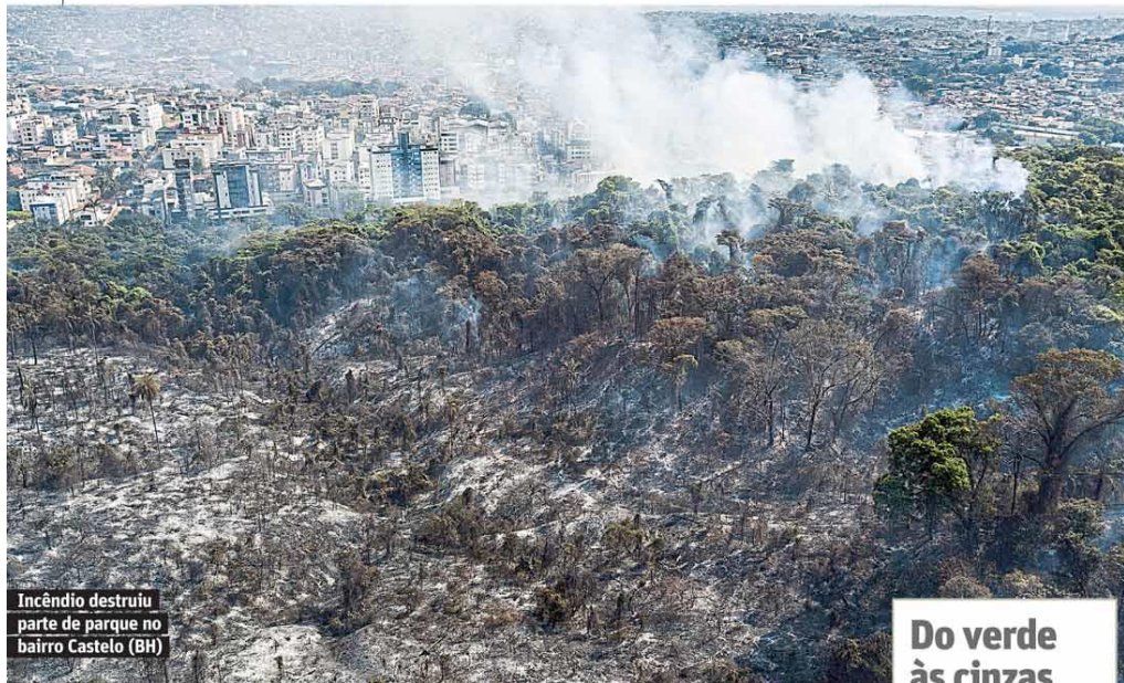
Incêndio destruiu parte de parque no bairro Castelo (BH)

Em Belo Horizonte Oito em cada dez eleitores dizem que vão às urnas Página 11