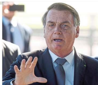
Jair Bolsonaro negou interferir na PF e criticou Moro

pôs no inquérito que apura ingerência política de Bolsonaro na PF. Na segunda, o novo diretor da instituição teve como primeiro ato justamente a troca do superintendente no Estado. Página 14