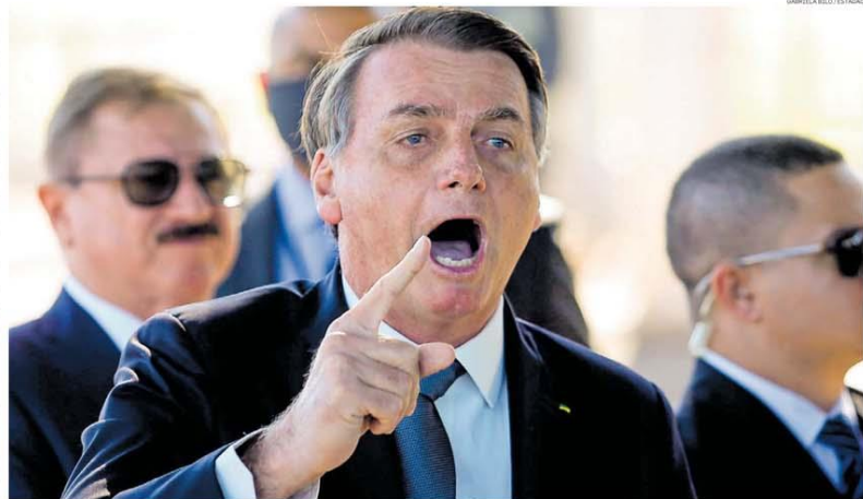
‘Cata a boca’. Bolsonaro manda jornalistas se calarem ao ser questionado sobre troca de superintendente da PF no Rio; mais tarde, ele se desculpa