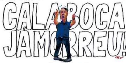
— Morreu nada, olha eu aqui!

MILÍCIAS DIGITAIS Grupos com até 30 mil membros são usados para atacar adversários