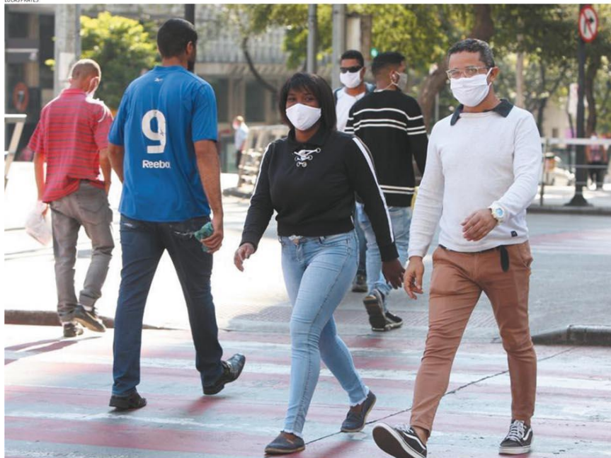
PARA TODOS - Máscara será obrigatória até para quem alegar não ter condições de comprar, PBH diz que vai distribuir 2 milhões de unidades

Quem for flagrado sem a proteção em BH, seja em lojas, ônibus ou nas ruas, terá que desembolsar até R$ 80. Medida semelhante já foi tomada por outras capitais para deter a Covid-19. Em Minas, mortes devem chegar a 200 até 6 de junho. HORIZONTES - P.8 E 9