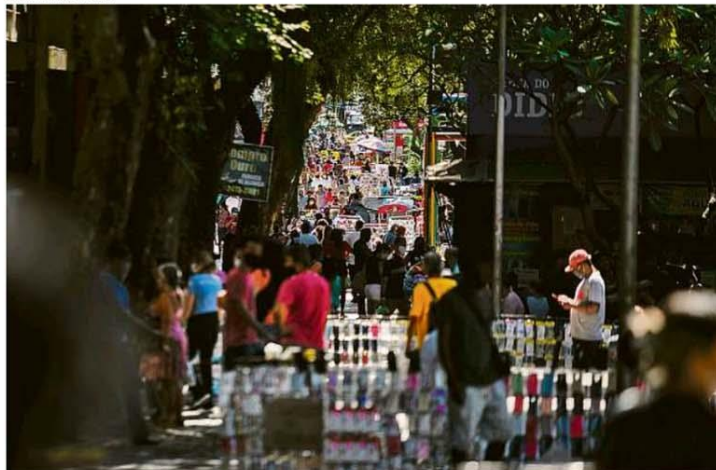
Com o aumento do movimento nas ruas, como visto ontem em Campo Grande, o governador Wilson Witzel anunciou que quem estiver em aglomeração em qualquer espaço público do estado será levado a uma delegacia e processado. MP-RJ pediu estudo sobre a viabilidade de um "lockdown". PÁGINA 8