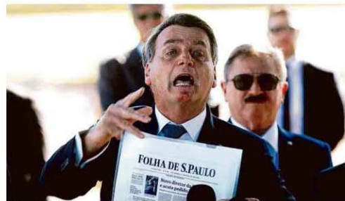
Jair Bolsonaro exhibe manchete da Folha e manda jornalista calar a boca.

Em depoimento, ex-ministro mostra mensagem do presidente pedindo troca da chefia da PF no Rio