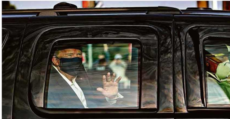
De carro, Donald Trump acena a apoiadores na porta do hospital militar em Maryland onde está internado desde sexta; depois, voltou ao hospital. ALEXANDER APP