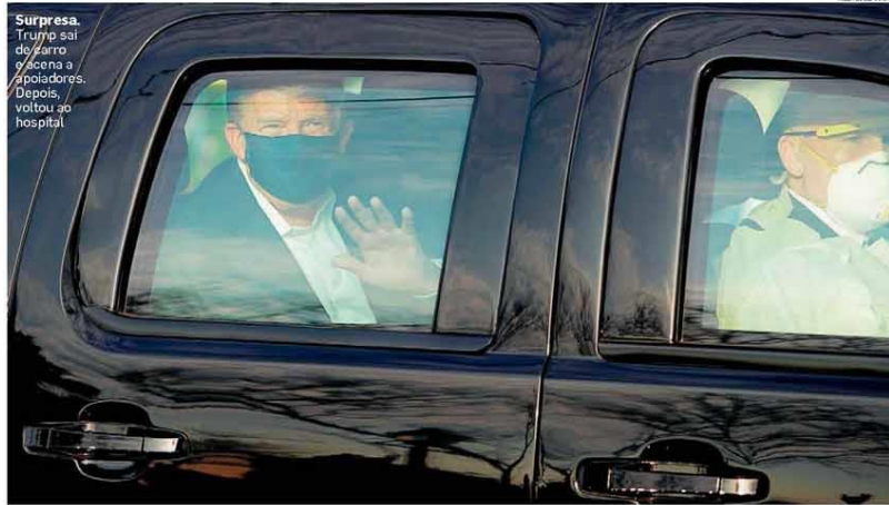
Surpresa. Trump sai de carro e cena a / apoladores. Depois, voltou ao hospital