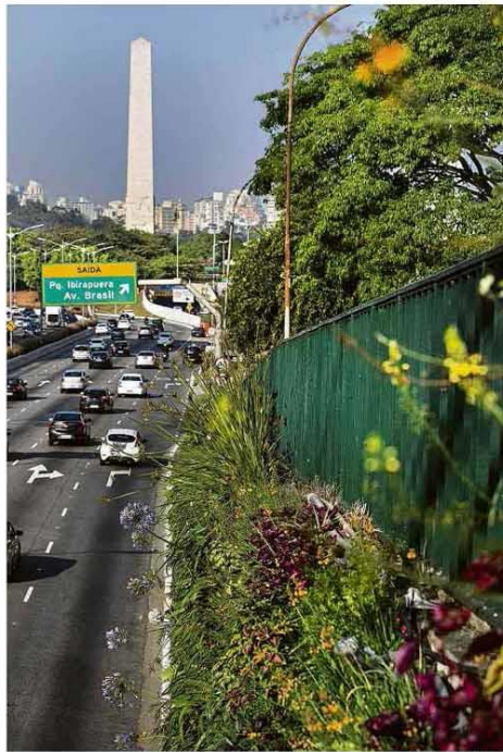
Eduardo Sznajd / Folhapress