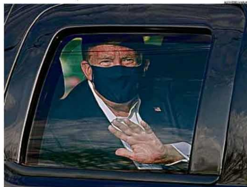
Trump acena para apoiadores, ao fazer um passeio de carro no entorno do hospital onde está internado. Ele está se tratando com medicamentos experimentais, mas que já tiveram autorização emergencial de autoridades de saúde. PÁGINA 22