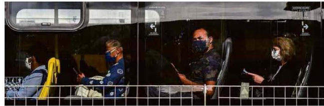
Parque Dom Pedro, no primeiro dia de uso obrigatório de máscara no transporte público de São Paulo.