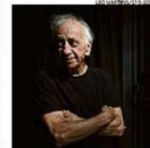
Adeus. Flávio era pauprista do Brasil

Profissional com mais de 60 anos de carreira em teatro, cinema e televisão, Flávio Migliaccio teve personagens memoráveis, como Xerife e Seu Chailta. Foi encontrado morto, aos 85 anos, no seu sítio, em Rio Bonito (RJ).