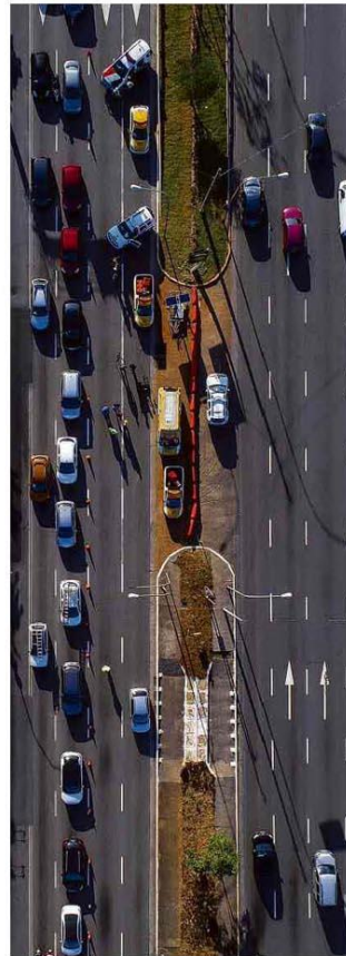
Radial Leste com bloqueio ontem de manhã.