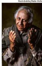
O ator paulistano Flávio Migliaccio, em foto de 2018

QUARENTENA EM SP Comércio H4 42 dias Escolas H4 42 dias Sábado que abre o que fecha em cada estado em folha.com