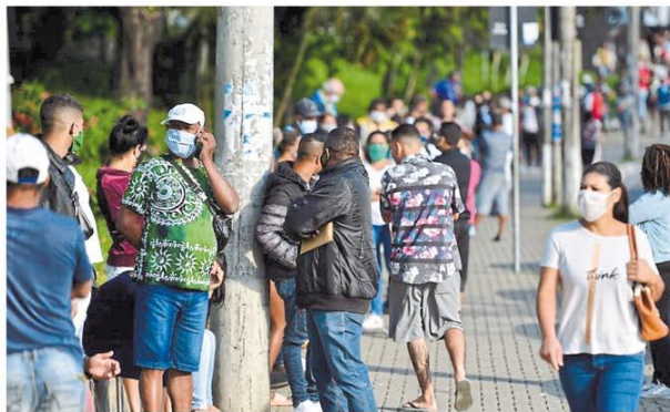
Fila sem fim. Ampliação do horário não evitou novas aglomerações em agências da Caixa ontem, com as pessoas tentando resolver pendências para receber os R$ 600. Página 8