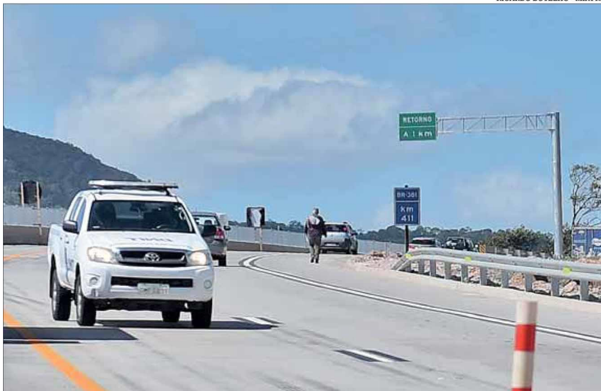
Ministro da Infraestrutura garantiu recursos para as obras de duplicação da BR-381