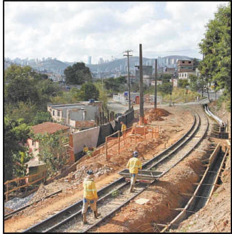
Estação ferroviária abandonada do Calafate: projeto é ligar o bairro ao Barreiro, mas não foi divulgado o cronograma da construção, por meio de parceria com iniciativa privada