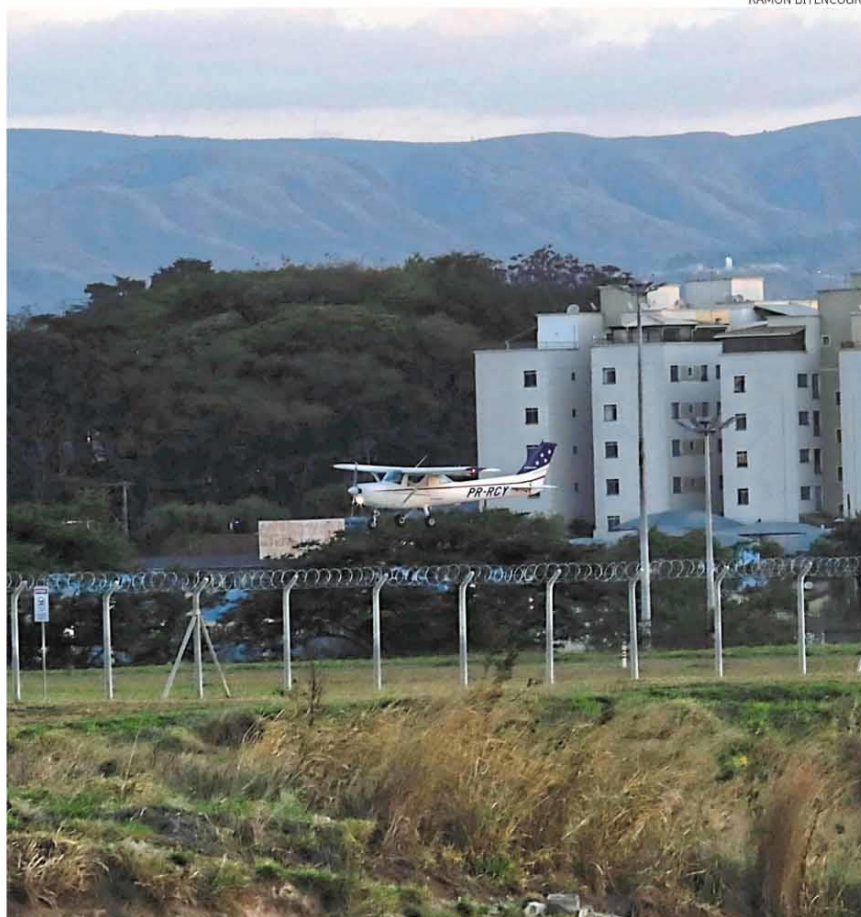
Estrutura. Aeroporto tem uma área de quase 580 mil metros quadrados e fica na região Noroeste

Correia informou ainda que deve apresentar na Câ-