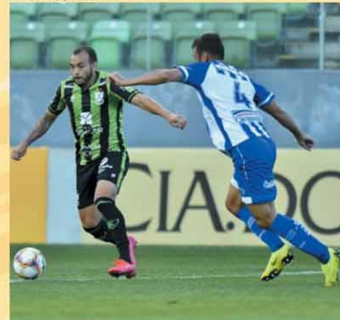
ACESSO - América venceu o CSA, no Independência