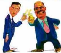
— Aos nossos eleitores, um brinde com água da bica!

Em no Rio de Janeiro pior do que está não fica: CMJ