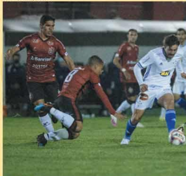
QUEDA - Cruzeiro perdeu para o Brasil-RS, em Pelotas