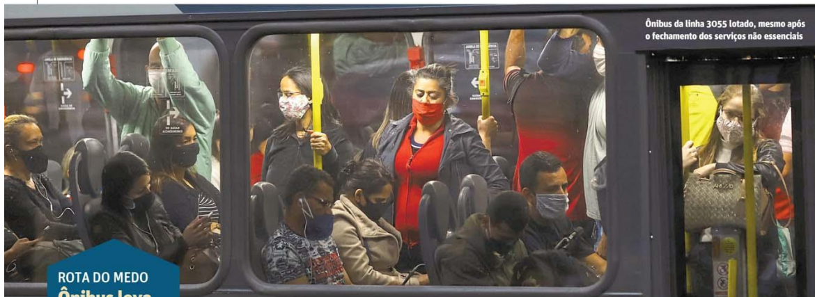
Ônibus da linha 3055 lotado, mesmo após o fechamento dos serviços não essenciais