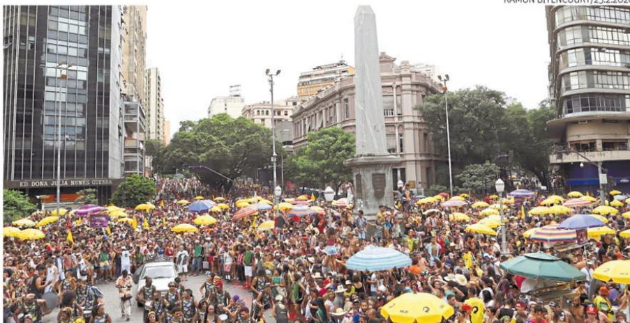
Folia. Carnaval de Belo Horizonte é um dos que mais atraem público no país para os blocos de rua

"Está mais difícil pegar os ônibus. Eles estão ficando cheios. Fico com muito medo do coronavírus".