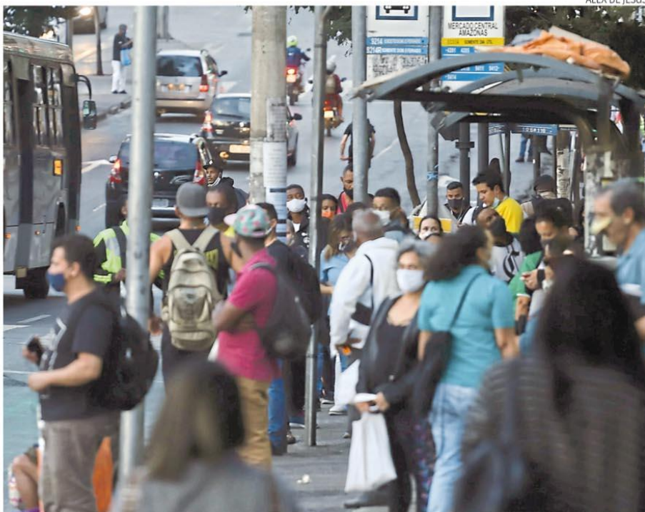
Aglomeração. Pontos de ônibus ficaram cheios nos últimos dias por causa da pausa do metrô