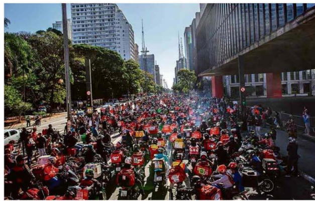
Entregadores de aplicativos durante protesto na av. Paulista por melhores condições de trabalho.

Ex-secretário diz que, em março, Saúde já projetava até 100 mil óbitos Saúde B6