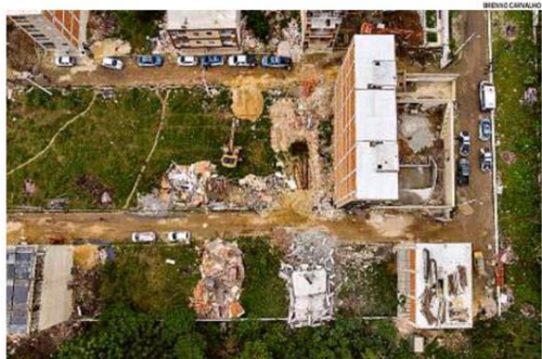
A prefeitura iniciou ontem a demolição de 21 prédios de um condomínio ilegal erguido pela milícia em área vizinha à Barra. Todas as unidades tinham gato de água e luz. PÁGINA 14