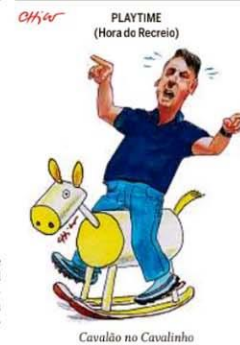
Cavalião no Cavalinho