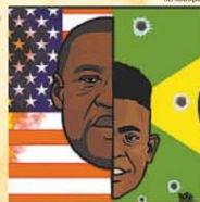
Ídolos do esporte compartilharam a ilustração acima cobrando justiça para George Floyd e João Pedro

Em discurso na Casa Branca, Trump invocou lei de 1807 e disse que enviaria as Forças Armadas para "rapidamente resolver o problema". Ele afirmou ser "o presidente da lei e da ordem", palavras usadas em suas publicações no Twitter, uma delas compartilhada por Bolsonaro.