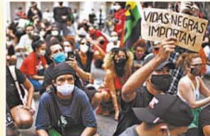
Manifestante confronta a polícia perto da Casa Branca, em Washington. Em Nova York (acima, à direita), que decretou toque de recolher, passeatas pacíficas durante o dia e saques à noite. No Rio de Janeiro, anteontem, protestos contra a violência policial carioca. Bolsonaro orientou apoiadores a não irem para as ruas no próximo domingo, em Brasília, devido a atos antifascistas marcados para o mesmo dia