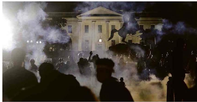
Manifestantes fazem protesto em frente à Casa Branca, que na noite de anteontem teve as luzes apagadas como medida de segurança.

Luiz questiona iniciativas suprapartidárias e diz não ter idade para ser 'maria vai com as outras' A5