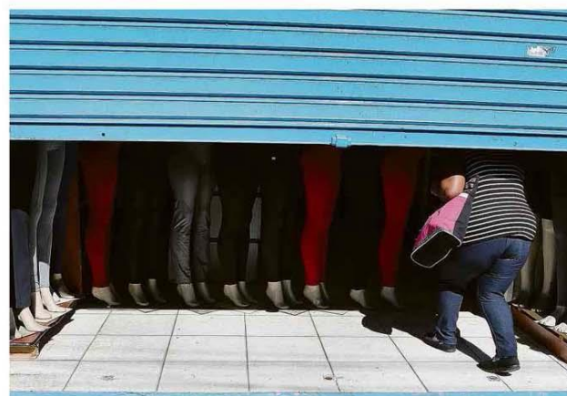
Loja de roupas funciona com a porta entreaberta no bairro do Brás, na região central de São Paulo.

Quadratura do centro Sobre rejeição a barganhas entre Bolsonaro e o grupo.