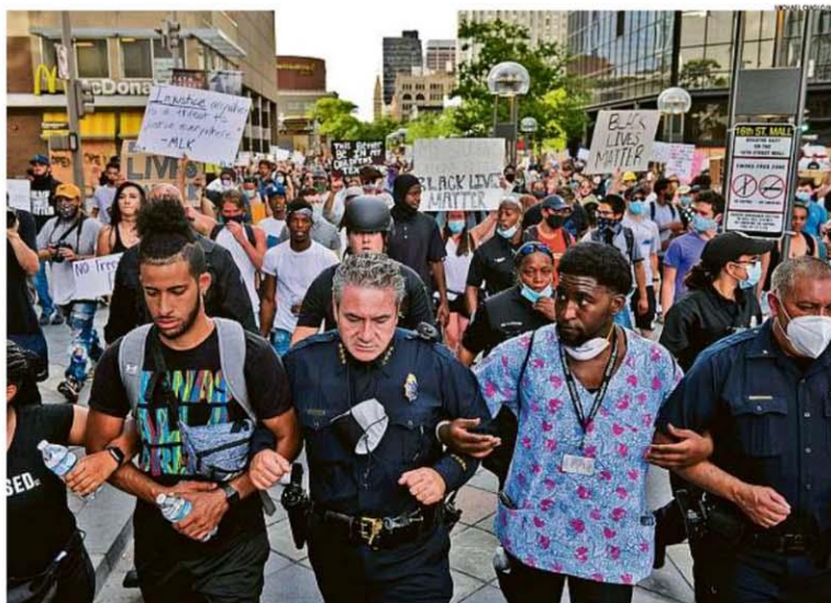
Em novo dia marcado por protestos nos EUA pela morte de George Floyd, integrantes das forças de segurança, como o chefe de polícia de Denver (foto), alinharam-se com manifestantes em várias cidades. Em outras, houve confronto. O presidente Trump disse que mandará o Exército a cidade ou estado que não defender "a vida e a propriedade" dos moradores. PÁGINA 23