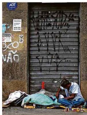
Morador de rua em São Paulo, população relata hostilidade e dificuldade em obter doações na crise

Antropóloga e autora de 'A Bela Velhice', passa a escrever às quintas