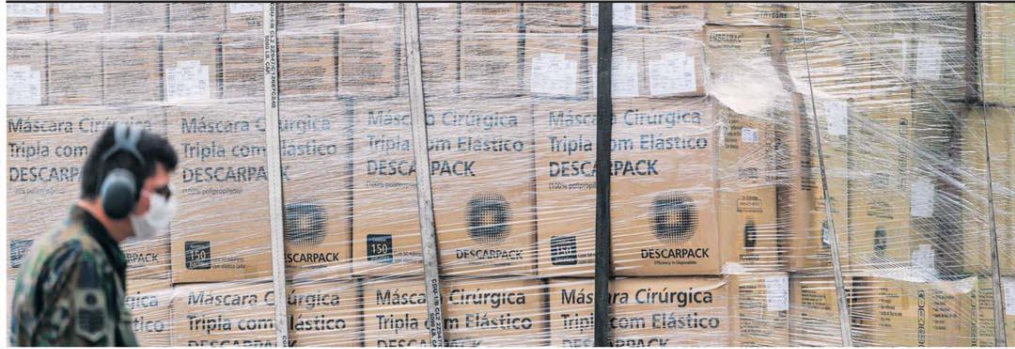
MÁSCARAS SIM, MAS DE PANO

Lote de máscaras é embarcado em avião da Força Aérea; temendo escassez, ministro da Saúde recomendou a população que pare de comprar máscaras descartáveis e faça a própria peça de proteção, com pano e elástico. METRÓPOLE / PÁG. A15