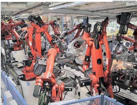
A Fiat Chrysler deve postergar investimentos previstos de R$ 8,5 bilhões na planta de Betim em 2020

A Fiat Chrysler Automóveis (FCA) com planta em Betim, deve adiar investimentos de R$ 8,5 bilhões em Minas, incluindo a nova fábrica de motores CSI Turbo, prevista para o fim de 2020. Já a BH Airport suspendeu aportes de R$ 130 milhões no Aeroporto Internacional de Belo Horizonte, em Confins, neste ano. Pág. 5