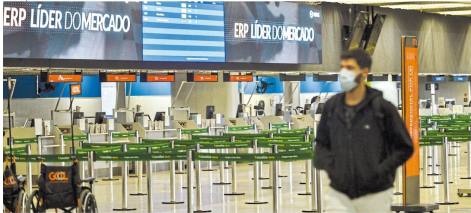
Sem viagens. Fluxo de passageiros em Confins cai de 30 mil por dia para cerca de 4.000; parte do terminal 2 foi fechada. Página 4