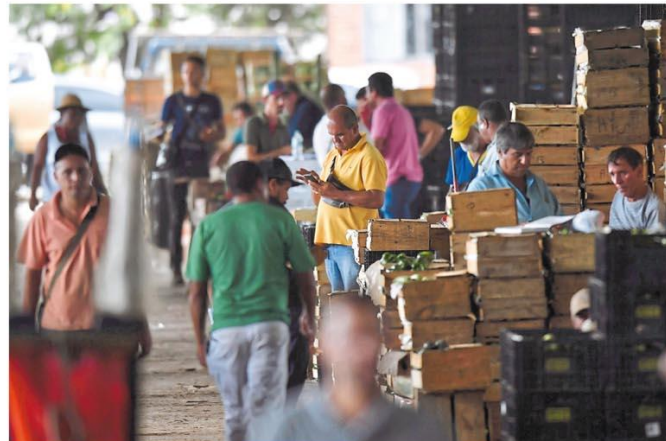
Abastecimento de alimentos na CeasaMinas, em Contagem, está normal, sem risco de falta de mercadorias nos próximos dias

PREFEITURA FABRICA MÁSCARAS PARA A REDE DO SUS NA CIDADE. Página 5