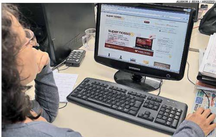
O Grupo Super Nosso aponta expansão de 1.000% nas vendas no canal virtual

higienização das unidades e carrinhos. A rede Verdemar criou um horário apenas para atender aos idosos. Já o Grupo Super Nosso registrou aumento de 1.000% nas vendas realizadas através do canal digital, o Super Nosso em Casa. Pág. 13