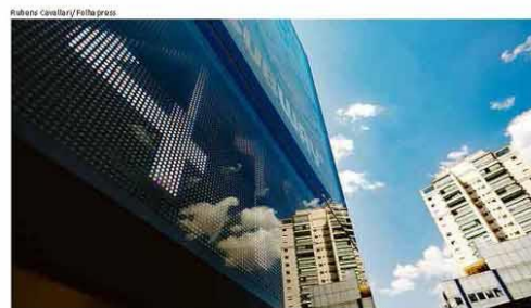
Termômetro de rua na av. Luiz Dumont Villares, na zona norte, chegou a registrar 49°C

Análise Felipe Buchatsky Poder presidencial e politização são entraves. A8