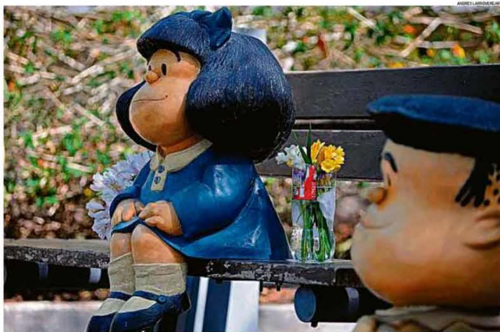
Foto. Estátua de Mafalda (com a ce Manolo em primeiro plano) em Mercedes, na Argentina, ganhou flores ontem, dia da morte de Quino, criador da personagem coitadada