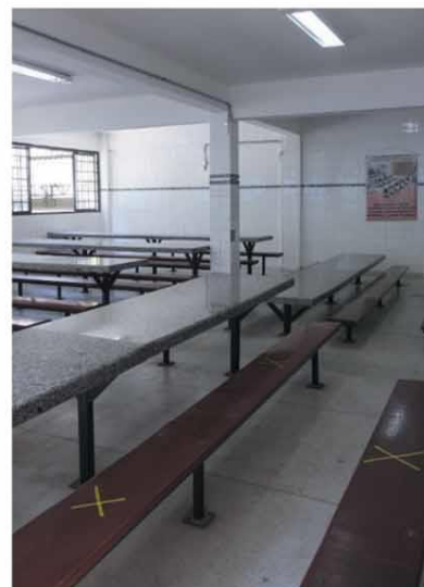
LUGAR MARCADO - À mesa, será um aluno em cada ponta