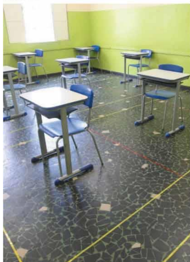
ESPAÇO FIXO - Carteiras: distância de 2 metros umas das outras