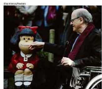
Quino com escultura de Mafalda, em 2014, na Espanha

Governo prorroga corte de jornada e salário até dezembro A22