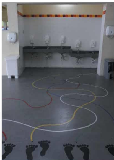
MÃO LIMPA - Fila para a pia e álcool em gel em todo canto