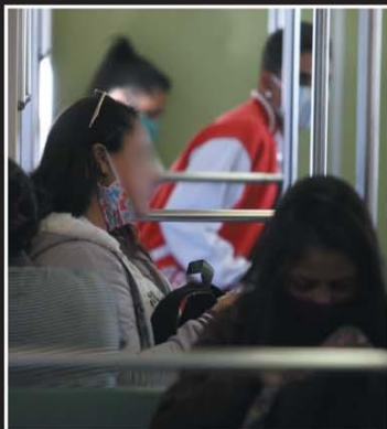
Uso incorreto de máscaras traz risco de contaminação