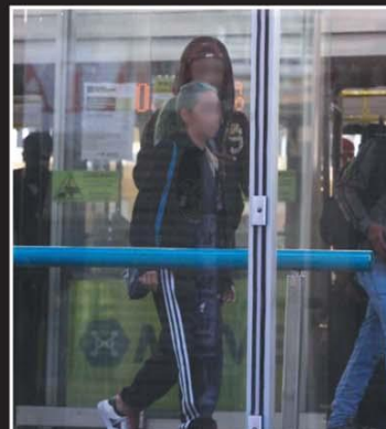
Mesmo sendo obrigatória, proteção no rosto é desprezada