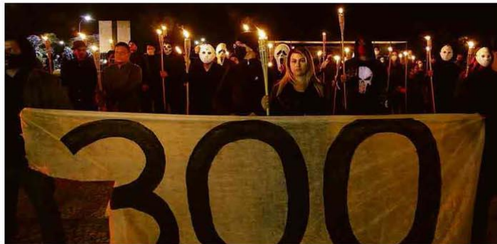
Grupo armado de extrema direita pró-Bolsonaro realiza protesto em frente ao STF.

Movimentos tentam agrupar adversários ideológicos contra um inimigo comum, o autoritarismo