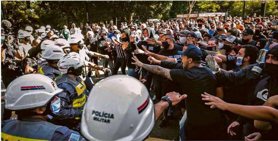
Organizada. Torcedores de Corinthians, Palmeiras e outros times se uniram num ato pró-democracia na Avenida Paulista, em São Paulo. Policiais militares separaram o grupo de uma manifestação de apoiadores do presidente Jair Bolsonaro

O domingo foi mais uma vez marcado por manifestações políticas mas, pela primeira vez desde o início da pandemia da Covid-19, grupos críticos ao governo ocuparam as ruas em oposição a manifestantes favoráveis a Jair Bolsonaro. Os novos atos, com gritos em prol da democracia, foram puxados por torcedores de clubes de futebol, como Corinthians, Flamengo e Palmeiras, a maior parte deles vestindo preto. Em São Paulo e no Rio de Janeiro, o encontro dessas novas vozes com os apoiadores de Bolsonaro e com a polícia levou a confrontos. Já em Brasília, as manifestações começaram na madrugada com o movimento 300 do Brasil, liderado pela blogueira Sara Winter, uma das investigadas no inquérito das fake news, acendendo tochas e entoando cânticos de guerra, em frente ao STF. Pela manhã, sem usar máscara, Bolsonaro se reuniu com apoiadores na Esplanada dos Ministérios. PÁGINAS 4 e 5