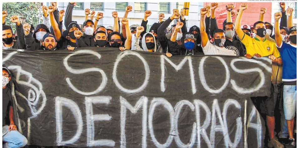
Membros de alas antifascismo de torcidas organizadas, movimentos sociais e de esquerda levaram faixas de apoio à democracia para as ruas de várias capitais