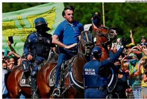
Sem máscara. O presidente Jair Bolsonaro mais uma vez compareceu a ato em Brasília favorável a seu governo

O domingo foi mais uma vez marcado por manifestações políticas mas, pela primeira vez desde o início da pandemia da Covid-19, grupos críticos ao governo ocuparam as ruas em oposição a manifestantes favoráveis a Jair Bolsonaro. Os novos atos, com gritos em prol da democracia, foram puxados por torcedores de clubes de futebol, como Corinthians, Flamengo e Palmeiras, a maior parte deles vestindo preto. Em São Paulo e no Rio de Janeiro, o encontro dessas novas vozes com os apoiadores de Bolsonaro e com a polícia levou a confrontos. Já em Brasília, as manifestações começaram na madrugada com o movimento 300 do Brasil, liderado pela blogueira Sara Winter, uma das investigadas no inquérito das fake news, acendendo tochas e entoando cânticos de guerra, em frente ao STF. Pela manhã, sem usar máscara, Bolsonaro se reuniu com apoiadores na Esplanada dos Ministérios. PÁGINAS 4 e 5