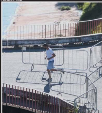
"Atleta" fura bloqueio na Andradas para se exercitar