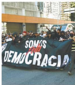
Em São Paulo, manifestantes contra o governo acabaram entrando em confronto com a polícia na Avenida Paulista. Em BH, simpatizantes do presidente fizeram carreta