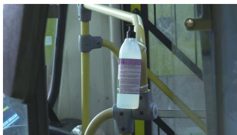
Em vários ônibus, álcool em gel estava na frente do carro, sem acesso a usuários que estavam ao fundo

De acordo com o Sindicato das Empresas de Transporte de Passageiros de Belo Horizonte (Setra-BH), a previsão era de que até o fim da tarde de sexta (29) 100% da frota estaria com álcool em gel disponível para os passageiros na entrada do ônibus.