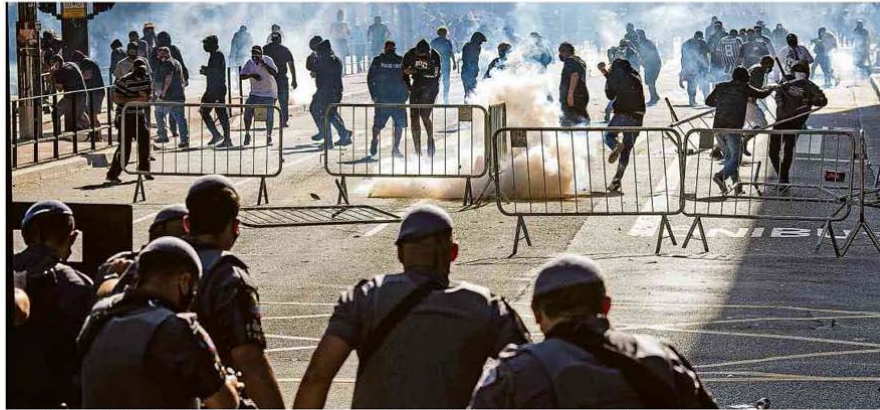
Ato pró-democracia de torcidas de futebol termina em confronto com PMs e apoiadores de Bolsonaro na av. Paulista, em São Paulo

52% são contra presença de militares no governo A7