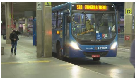
Ônibus da linha 510 chegou à Estação Pampulha sem dispenser com álcool em gel

Um carro da linha 510 chegou à estação sem o dispenser com álcool em gel. Em outros ônibus, o equipamento estava na parte da frente, próximo ao motorista e sem acesso dos passageiros que estavam mais ao fundo, especialmente nos carros articulados.