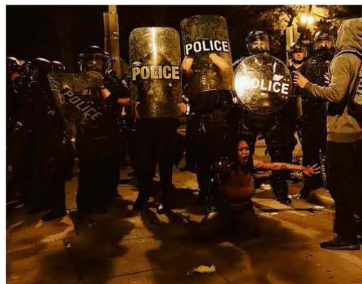
Manifestante tenta impedir passagem de policiais em ato perto da Casa Branca.

As manifestações deixaram quatro mortos e ao menos 1.700 presos. Há registros de carros e viaturas incendiados, saques e espancamentos. Os atos, que chegaram a Berlim e Londres, são marcados por gritos de "não consigo respirar", frase repetida por Floyd enquanto era sufocado. Mundo A8