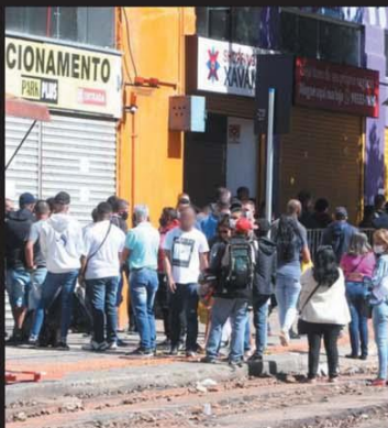
Ordem para evitar aglomerações é desrespeitada

Machado. Ampliar flexibilização da quarentena depende do índice de transmissão do coronavírus, da taxa de isolamento e da ocupação de leitos. HORIZONTES - P.10