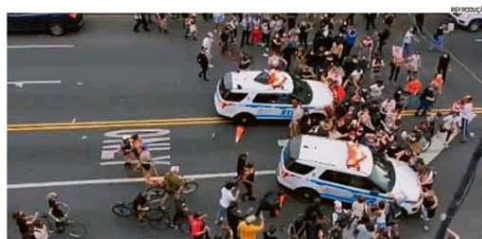
Carros da polícia avançaram sobre manifestantes em Nova York, em mais protestos pela morte de George Floyd; 25 cidades declararam toque de recolher. PÁGINA 15