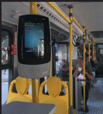
Ônibus descumprir decreto que obriga oferecer álcool em gel