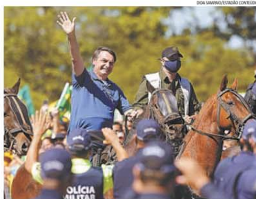
Depois de sobrevoar a Esplanada de helicóptero, Bolsonaro montou em um cavalo da PM e circulou entre seus apoiadores. Em várias cidades, a polarização do país ficou nítida