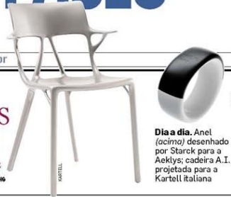
Dia a dia. Anel (acima) desenhado por Starck para a Aeklys; cadeira A.I., projetada para a Kartell Italiana

Renomado, francês diz que design, por si só, não faz mais sentido: 'A evolução humana me interessa'. PÁG. 106