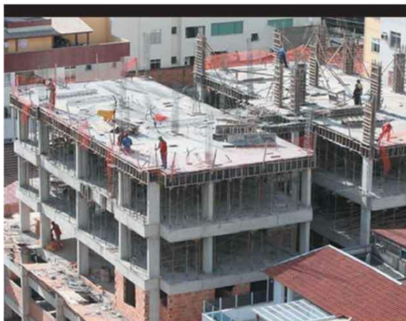
BOOM – Desempenho surpreendente da construção civil impactou a indústria no geral