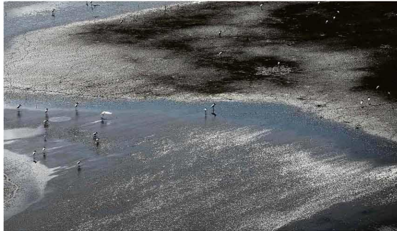
Tuiúis e garças no que restou de lagoas na região de Corumbá (MS), após recorde histórico de incêndios a fetar a região.

Presidente afirma que laboratórios deveriam ter interesse no Brasil B4