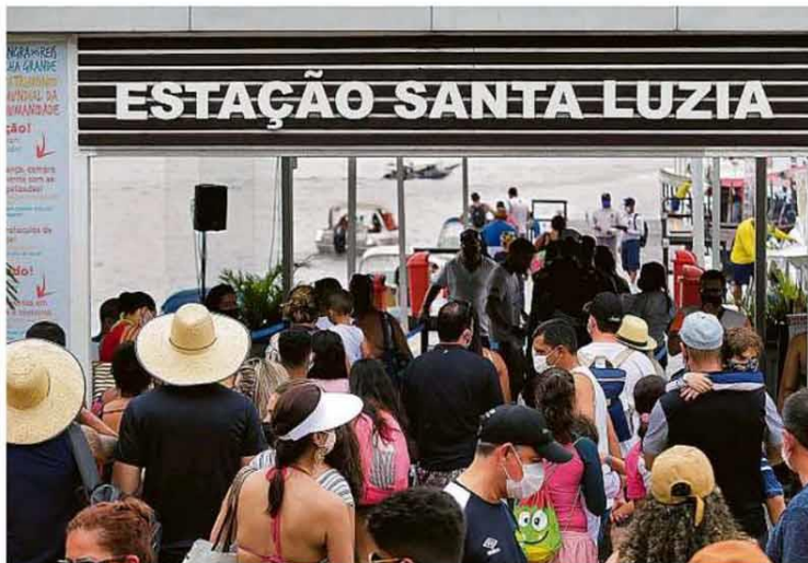
Multidão enfrenta fila para entrar na Ilha Grande, que passou a exigir comprovante de hospedagem para liberar turistas. No Rio, a prefeitura vai instalar bloqueios para impedir o acesso à orla da Zona Sul à Barra na virada de ano, o que deve afetar até reuniões em família. PÁGINA 8