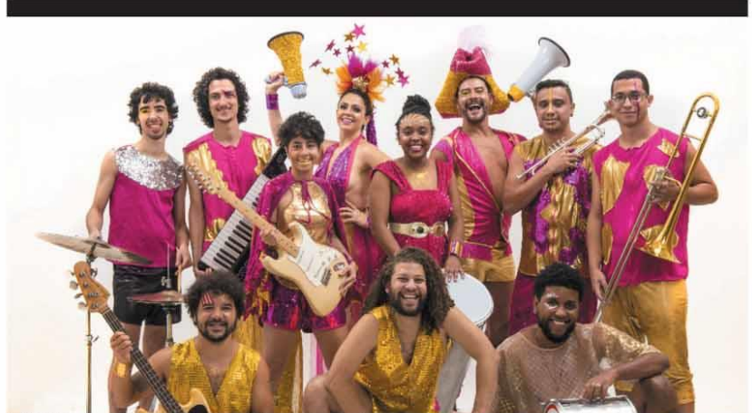
PLAYLIST - Repertório apresentado ao público estará recheado de composições próprias e muito axé