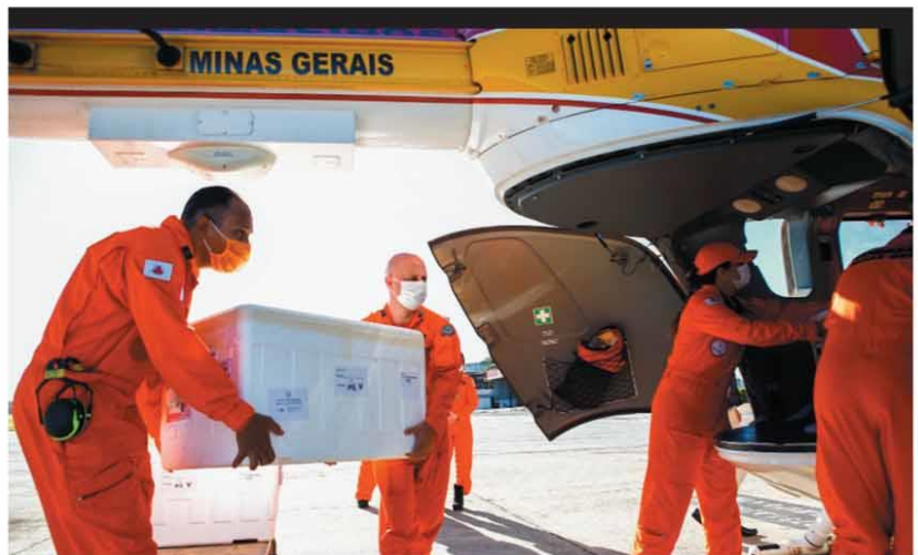
ARMAZENAMENTO - Doses ficam guardadas em condições ideais de temperatura até que o uso seja iniciado