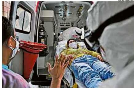
WORLD NEWS GROUP