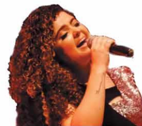
ELIO PARABISO/BENDITA COMUNICAÇÃO/INVOLUÇÃO

Aposta na nova geração. Festival de Jazz da Montanha começa hoje, em formato digital, transformando BH na capital brasileiro do gênero musical. ALMANAQUE - P.10