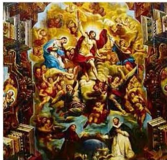
Pintura da igreja de São Domingos, em Salvador

Livro mostra como o medo do inferno levou à criação de igrejas em Salvador