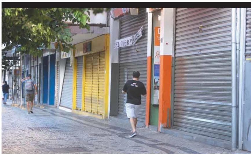
CENÁRIO PREOCUPANTE - A CDL informou que de 7,5 mil a 10 mil dos 150 mil comércios e serviços da cidade fecharam as portas na pandemia em Belo Horizonte, desempregando 100 mil trabalhadores

pode pegar até 12 anos de cadeia. Cidadão deve delatar infratores que arrumam um jeitinho para burlar o sistema de saúde. HORIZONTES P. 8 E 9