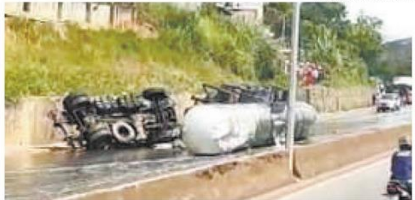
Caminhão pesado ainda derramou no asfalto o produto que transportava

De acordo com o Corpo de Bombeiros, o caminhão transportava aproximadamente 30 mil litros de óleo de transformador, sendo que cerca de 15 mil litros escorreram pela rodovia. Ainda de