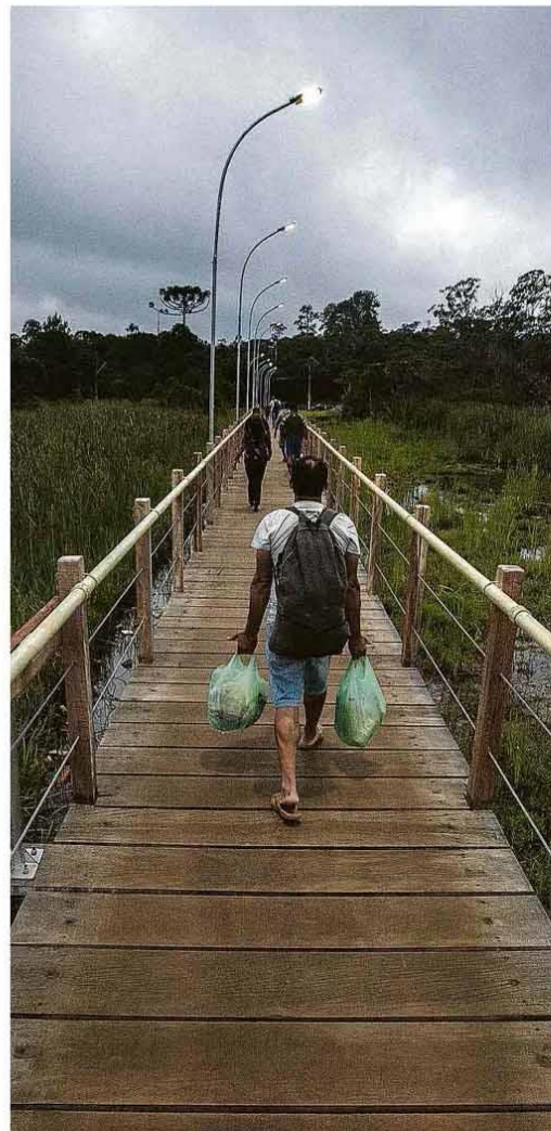
Maíra Bergamas/Folha press