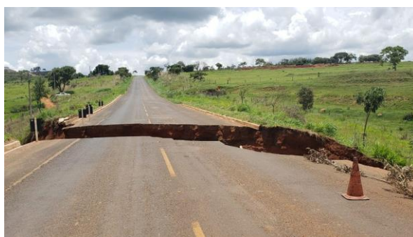
Cratera se abriu no trecho na MGC-462, que dá acesso a Perdizes e Patrocínio

Por G1 Triângulo e Alto Paranaíba 25/01/2021 08h33 Atualizado há um dia