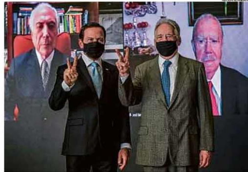
Ex-presidentes. Doria em cerimônia a pró-vacina com presença de Fernando Henrique e apoio virtual de Temer e Sarney

Oferta será ampliada com importação da Índia e chegada de insumos para Butantan e Fiocruz