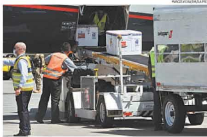
Avião da Azul chegou a Confins ontem com 190,5 mil doses da vacina da Oxford/AstraZeneca

As 190,5 mil doses da vacina contra a COVID-19 da Oxford/AstraZeneca para Minas chegaram a Confins ontem, sob forte esquema de segurança. Segundo o governador Romeu Zema, a carga será distribuída segundo o rítmo do Plano Nacional de Imunização e a expectativa é estabelecer "um fluxo contínuo, permitindo a ampliação dos grupos atendidos". Enquanto a imunização segue lenta no país, governo federal e Pfizer travam uma batalha de declarações sobre a aquisição do imunizante da empresa. PÁGINA 8