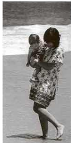
Nara Leão e o filho, Francisco, em 1973.

Com menos burocracia, MEI é opção para quem está começando