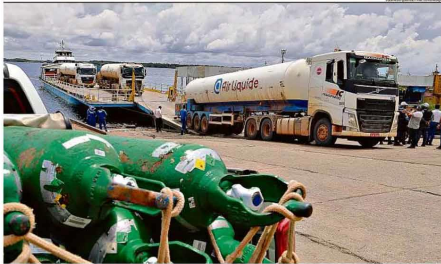
Socorro. Seis carretas transportando oxigênio chegaram a Manaus, e mais uma era esperada na noite de ontem. De acordo com o Ministério da Saúde, no entanto, a carga não resolverá o problema em definitivo

Trinca Marinho (1876-1925) — (1904-2003) Roberto Marinho RIO DE JANEIRO, SEGUNDA-FEIRA, 25 DE JANEIRO DE 2021. ANO XLVII - Nº 33.543 - PREÇO DESTA EXEMPLAR R$ 0,10 - R$ 5,00