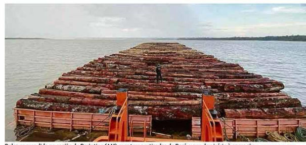
Balsa apreendida na região de Parintins (AM) com toras retiradas do Pará e que deu início à operação. Investigação Polícia Federal

Estamos em 2020, ano que transformou a palavra festa em sinônimo de surto coletivo. A época mais festiva acontece no momento menos propício a festejos. Boas festas: para quem? Não sou cidadã neozelandesa nem voluntária da Pfizer. Ilustrada B9