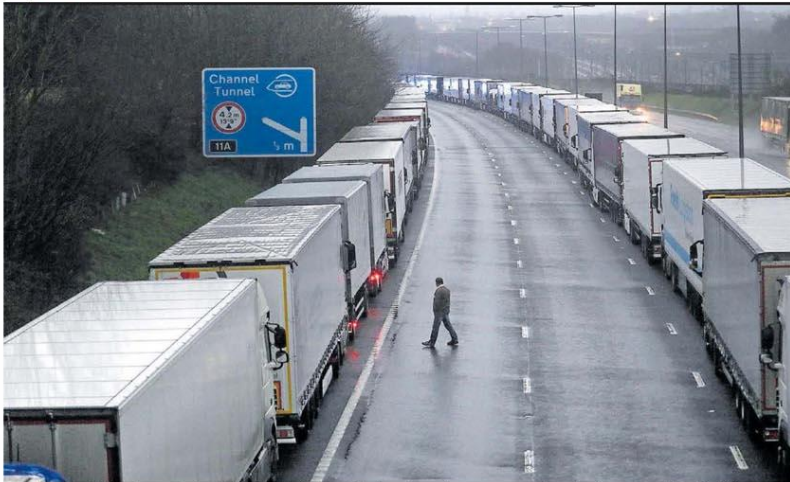
Fronteira. Caminhões de carga vindos do Reino Unido são impedidos de entrar na França por causa da pandemia; acesso ao Eurotúnel foi suspenso