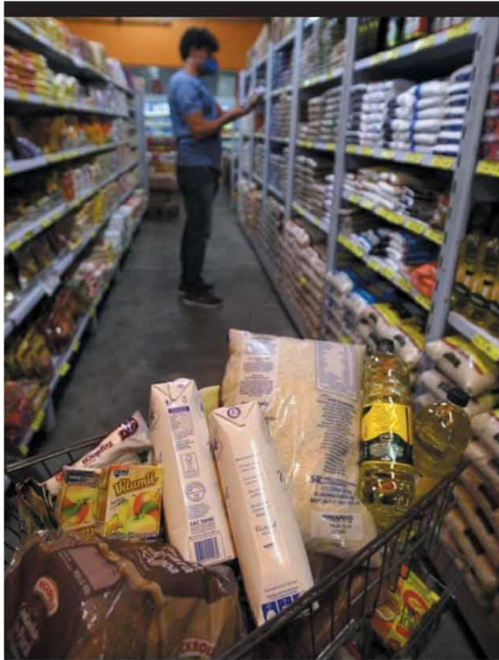
COMPRAS — Orientação é observar se produtos mais em conta são da mesma qualidade dos mais caros