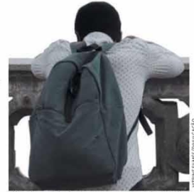
Nigerianos ajudam a mostrar uma São Paulo bem diferente daquela que o cinema costuma exibir. Confira em "Cidade Pássaro", estreia de hoje na Netflix. ALMANAQUE - P.11

19°C A 30°C SOL E AUMENTO DE NUVENS DE MANHÃ. FRAZADAS DE CHUVA À TARDE E À NOITE. TERÇA BELO HORIZONTE, MG