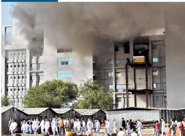
Índia. Cinco pessoas morreram em incêndio na fábrica da AstraZeneca/Oxford. A suspeita é que o fogo tenha tido origem na soldagem de uma obra no local. As doses contra a Covid não foram afetadas. Página 7