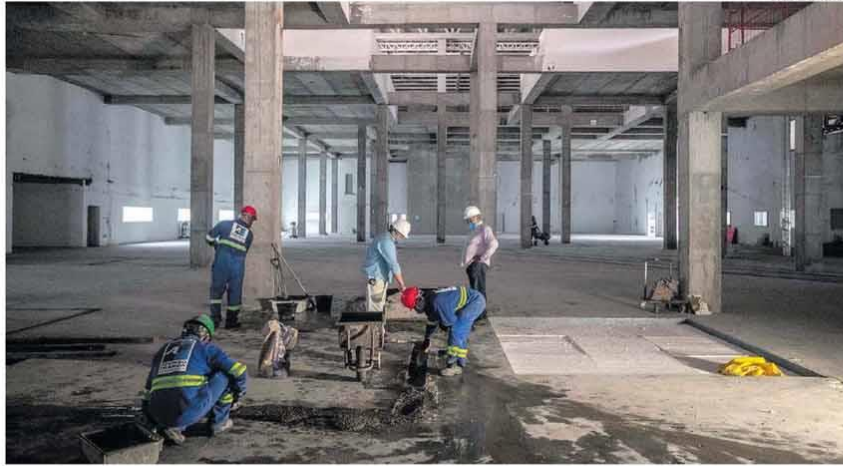
Daqui sairá uma fábrica de vacinas

Operários trabalham na construção da fábrica do Instituto Butantan, na zona oeste de SP, que fará a Coronavac. A previsão é de que a obra fique pronta em outubro. Ali ficarão reatores, biorreatores e centrifugas cuja missão é 'fabricar' o material que, hoje, é importado da China para a produção da vacina. METRÓPOLE/PÁG. A9