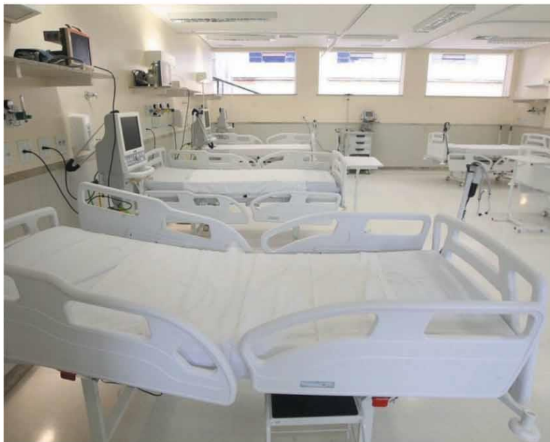
REFORÇO - Quarenta leitos de UTI para pacientes com Covid-19 foram inaugurados ontem no Hospital Júlia Kubitschek, em BH

Luto trazido pela Covid marca famílias de todas as regiões. Alto Vera Cruz (Leste) é o bairro recordista em óbitos, seguido pela Serra (Centro-Sul). Já em número de casos da doença quem lidera é o Buritis, na zona Oeste - são 1.260. Mapeamento mostra que risco existe para qualquer classe social, dizem médicos, e que por isso a prevenção deve ser coletiva. Cidade atingiu ontem 80 mil confirmações da doença. HORIZONTES - P.8