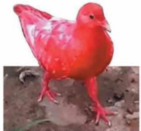
Pombos coloridos viraram caso de polícia em Leopoldina. Investigadores tentam descobrir quem pintou as aves de vermelho, verde e azul, o que pode configurar maus-tratos.