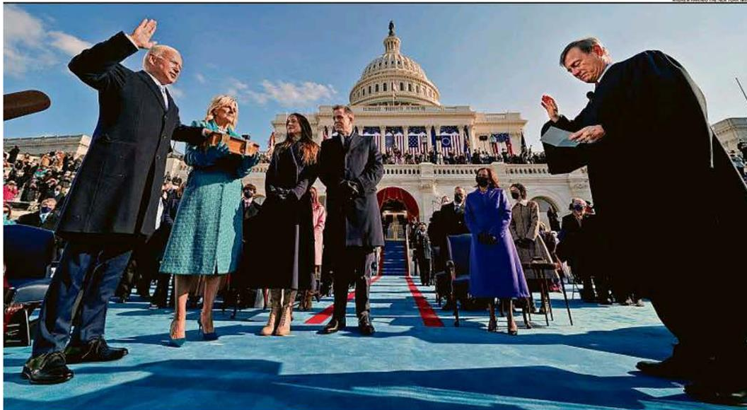
Solenidade. Joe Biden jura cumprir a Constituição dos EUA diante do presidente da Suprema Corte, John Roberts, tendo ao seu lado a mulher, Jill, e os filhos Ashley e Hunter; à direita de Roberts, na primeira fila, a vice Kamala Harris