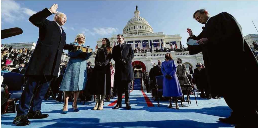
Ao lado da mulher, Jill, e com a vice, Kamala Harris (de roxo), a observá-lo, Joe Biden faz juramento diante do chefe da Suprema Corte, John Roberts.