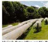
Vinícola Entre Vilas, em São Bento do Sapucaí, na região da serra da Mantiqueira.

Para Maia, Pequin não atrasa insumo por política B3