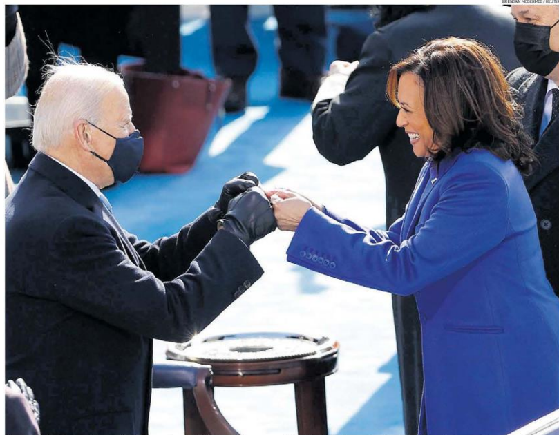
Figura de destaque. Kamala Harris cumprimenta Biden: mulher, negra e filha de imigrantes, a vice deverá ter importante papel no governo

Duas semanas após a invasão do Capitólio por extremistas incentivados por Donald Trump, o democrata Joe Biden tomou posse como presidente dos EUA e, em seu discurso, fez um contundente apelo pela união dos americanos para enfrentar as crises econômica, sanitária e política. E celebrou: "A democracia prevaleceu". Em cerimônia com poucos convidados, mas com a presença de estrelas como Lady Gaga e Jennifer Lopez, Biden afirmou que o país saudava "o triunfo não de um candidato, mas de uma causa: a causa da democracia". O novo presidente também citou o combate ao terrorismo doméstico e ao supremacismo branco como desafios de sua gestão. E assinou várias ordens executivas para desfazer medidas adotadas por Trump em áreas como saúde, ambiente e imigração. Biden chamou o momento atual de uma "guerra incivil", que opõe "o vermelho (cor do Partido Republicano) ao azul (cor do Partido Democrata)", o rural ao urbano, o conservador ao liberal". A ausência de Trump na cerimônia foi ignorada por Biden. Na plateia estavam Barack Obama, Bill Clinton e o republicano George W. Bush. INTERNACIONAL / PÁGS. A10, A12 e A14 e A17