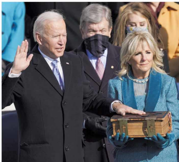
EUA. Sem Trump, Joe Biden toma posse como o 46º presidente norte-americano e faz discurso pela união e sobre a vitória da democracia. Bolsonaro o cumprimenta pela primeira vez. Páginas 16 e 17