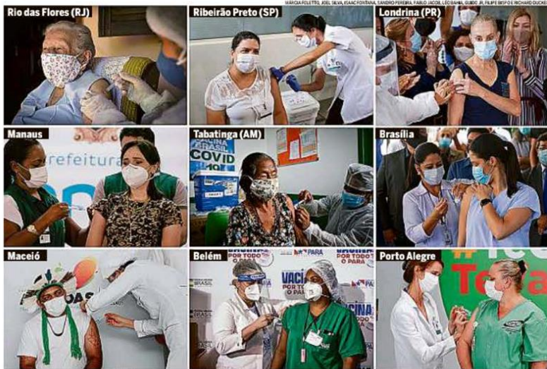
Diversidade e esperança Nas principais capitais do país e em algumas cidades do interior, profissionais da saúde, indígenas e idosos, grupos prioritários, recebem a vacina

Enquanto as cenas de pavor em hospitais da capital amazonense fazem com que pacientes com Covid-19 fiquem para casa, com medo de morrer longe da família, a falta do insumo começa a causar fatalidades em municípios do interior do Amazonas e do Pará. Em Manaus, 49 bebês dependem de oxigênio para viver, e o governo não sabe quanto durará o estoque, releta o enviado LEANDRO PRAZERES . PÁGINA 10