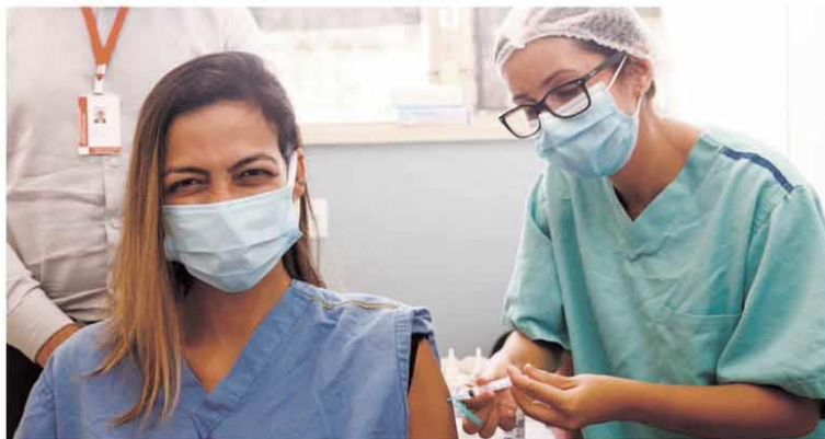
Com a disponibilização das vacinas pelo Estado, profissionais de saúde de Belo Horizonte começaram a ser imunizados

■ Todas as regionais de saúde do interior começaram a receber a Coronavac ontem. O governador Romeu Zema disse que o processo de imunização será longo e pode levar até um ano, dependendo da disponibilidade da vacina. Para a produção nacional, Butantan e FioCruz dependem da importação de mais insumos, e Rodrigo Maia (DEM-RJ) pediu audiência com representante chinês para agilizar entrega, enquanto a Índia excluiu o Brasil de lista de exportação do imunizante. Em BH, avança a aplicação em 63 mil profissionais de saúde – ainda não há data para os demais grupos. Páginas 7 a 10