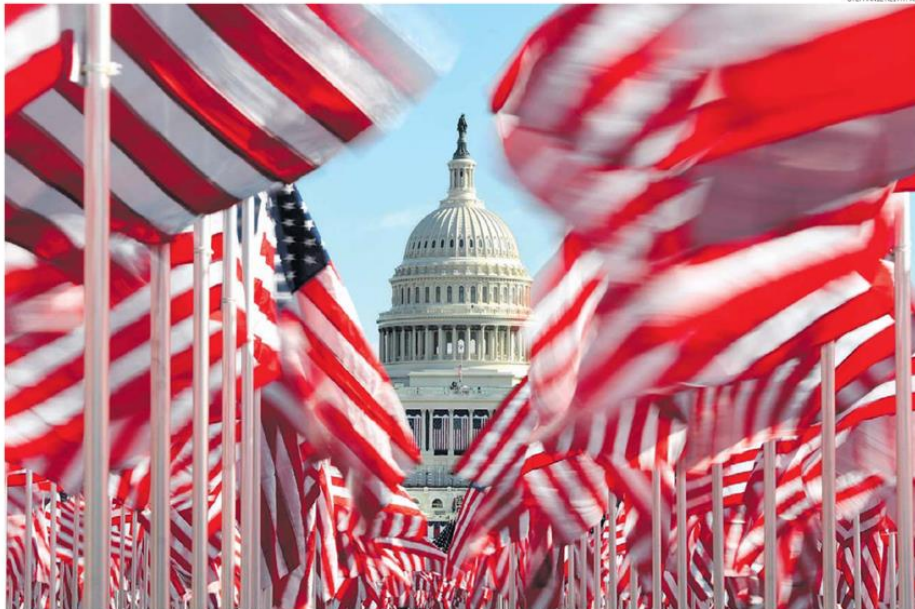
Bandeiras no lugar de gente. O Capitólio, cercado por forte esquema de segurança; Washington tem avenidas, ruas e monumentos fechados