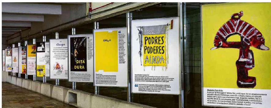
Exposição de obras da campanha em defesa da democracia na sede do jornal, nos Campos Eliseos, que pode ser visitada com agendamento.

Tatiana Prazeres Ante leitores exigentes, cobrir China desafia A23