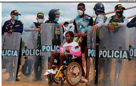
RAÍDO MADRE DE DEUS/ANT

Com 600 imigrantes, a maioria haitiana, retidos na fronteira fechada do Peru, Assis Brasil, pequena cidade no Acre, decretou calamidade. PÁGINA 23