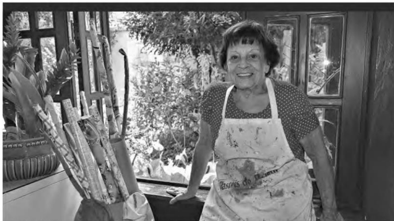
MÃOS A OBRA - Natureza sempre inspirou a artista, que lamenta devastação provocada pelo homem