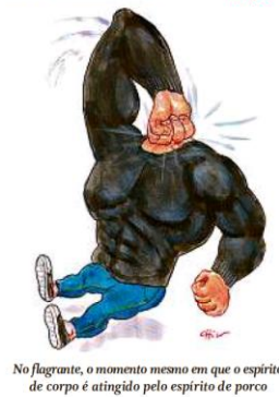
No flagrante, o momento mesmo em que o espírito de corpo é atingido pelo espírito de porco