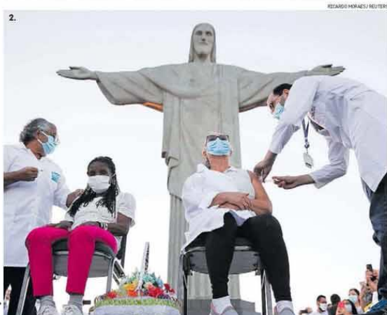
1. Avião da FAB é carregado com vacina; alguns Estados não haviam recebido o imunizante até ontem à noite; 2. Aos pés do Cristo Redentor, idosa e técnica de enfermagem são as primeiras a receber a Coronavac no Rio; 3. Em São Paulo, médicas comemoram após ser vacinadas