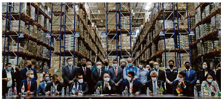
O ministro da Saúde, Eduardo Pazuello (centro), durante reunião com governadores ontem para distribuição das vacinas, em Guarulhos (SP)

O Rio corre o risco de novo recorde de pandemico: três Carnavais em um ano. Com praias e áreas de lazer liberadas, não vejo como segurar os blocos no mês que vem. Será o Carnaval clandestino. Opinião A2