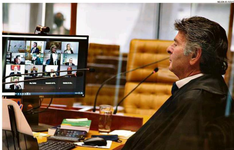
Inexpressivo. Na sessão do Supremo, o presidente, Luiz Fux, precisou recorrer a Alexandre de Moraes para lembrar o nome do deputado, mais conhecido por violência em campanha

Plenário decidirá sobre deputado Daniel Silveira, acusado de atacar democracia