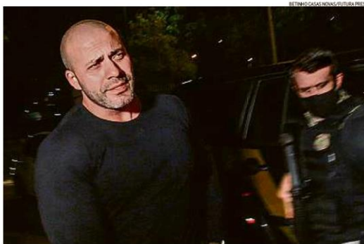
Agressivo. Daniel Silveira chega ao IML, no Rio. Parlamentar ofendeu a policial que pediu que ele usasse máscara

O Supremo Tribunal Federal (STF) confirmou, por unanimidade, a prisão em flagrante do deputado Daniel Silveira (PSL-RJ), determinada anteriormente pelo ministro Alexandre de Moraes após o deputado postar vídeo com ataques à democracia, exaltação ao A1-5, além de ameaças e incitação à violência contra ministros da Corte. A decisão elevou a pressão sobre a Câmara por uma punição. O presidente da Casa, Arthur Lira (PP-AL), tenta acordo para libertar Silveira, mas sinaliza estar disposto a puni-lo: a Mesa Diretora reativou o Conselho de Ética e encaminhou representação contra ele. O plenário da Câmara terá que decidir sobre a prisão. A Procuradoria-Geral da República (PGR) apresentou denúncia ao STF contra Silveira, na qual o acusa de três crimes contra os ministros da Corte. Para juristas, prisão em flagrante tem base legal, por ter ocorrido logo depois da divulgação do vídeo. Ex-PM, Silveira passou 80 dias preso ou detido nos quase seis anos em que esteve na corporação. O presidente Bolsonaro não se manifestou sobre a prisão. PÁGINAS 4 a 8