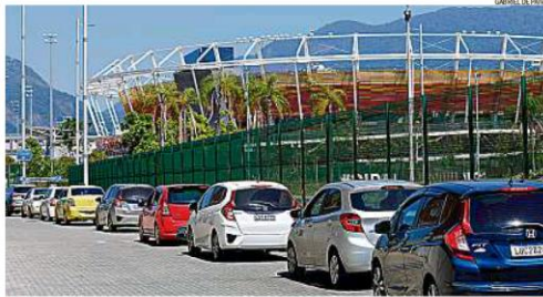
Última chance. Na véspera da interrupção da vacinação no Rio, filas foram longas no drive-thru do Parque Olímpico

Curitiba e Porto Alegre até o início da próxima semana. Prefeitos cobraram um cronograma com prazos e metas para a imunização de cada grupo, após "sucessão de equívocos". O Ministério da Saúde afirmou que não há previsão para o envio de novas doses para os 26 estados e o Distrito Federal. PÁGINA 9