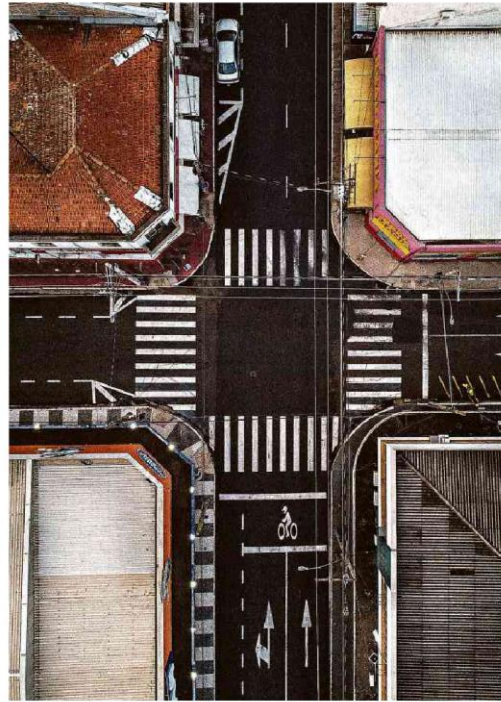
Cruzamento no centro comercial de Araraquara (SP), cidade sob lockdown

Objeto de lobby político, a autorização para uso emergencial da vacina russa Sputnik V no Brasil está distante na Anvisa. O governo afirma ter interesse em comprar 10 milhões de doses, mas a agência afirmou ao Supremo que faltam documentos. Saúde B5