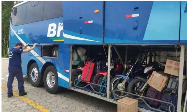
Viagens fretadas não seguem regras impostas às empresas regulares, como itens que podem ser transportados nos bagageiros

17/02/2021 06:00 - atualizado 17/02/2021 07:50