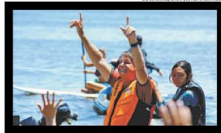
Bolsonaro passeou ontem de moto aquática em Santa Catarina e voltou a provocar aglomeração