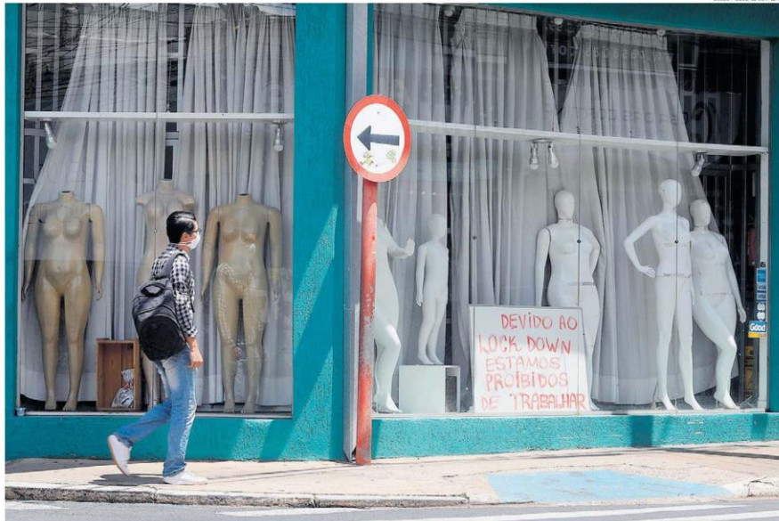
Sem comércio. Placa em Araraquara reclama de lockdown na cidade; medida dura é inédita no Estado e ocorre após 12 casos da nova cepa da covid

O Estado de São Paulo já tem 25 casos da variante da covid-19 do Amazonas, sendo que 16 deles são de transmissão local. A maior parte está em Araraquara, cidade que decretou lockdown antecedente. Outros municípios do interior endureceram medidas diante do temor de colapso do sistema de saúde. Nove casos são da capital. Segundo o governo, não há comprovação de que a variante seja mais transmissível ou mais grave. METRÓPOLE / PÁG. A13