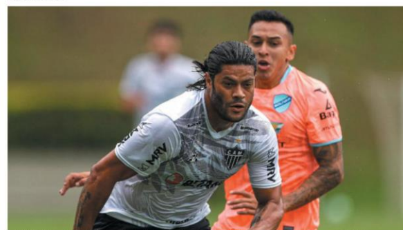
ESTRELA — O meia-atacante Hulk é a maior atração atleticana para a temporada 2021