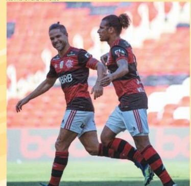
VICE — Flamengo venceu e segue na cola do Colorado