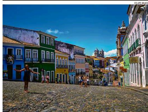
Respeito. Em Salvador, o Pelourinho, onde ficam as sedes dos blocos Filhos de Ghandy e Olodum, vazio no domingo

IRAPUÁ SANTANA No BBB21, um exemplo didático de luta antirracista PÁGINA 5