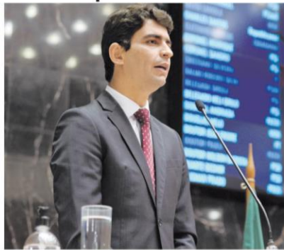
Deputado do PSD estará à frente de grupo majoritário na ALMG

Ainda de acordo com o líder, a relação com o governo Zema será de harmonia e "boa vontade". Como se tra-