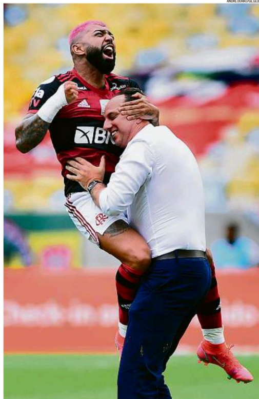
Abraço da vitória. Gabigol comemora com Rogério Ceni o gol que garantiu o triunfo do Flamengo sobre o Corinthians

O Flamengo bateu o Corinthians por 2 a 1, ontem, no Maracanã, e se manteve um ponto atrás do líder Internacional. Os dois times se enfrentam no próximo domingo, no Maracanã, em jogo que pode decidir o Brasileiro. ESPORTES