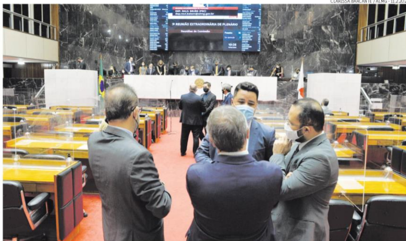
Esclarecimento. Parlamentares da ALMG entendem que governo de Minas tem dinheiro em caixa para quitar integralmente o 13º salário

Segundo ele, o Estado teria recebido R$ 3 bilhões do governo federal no último ano a partir do programa de apoio aos Estados e municípios durante a pandemia, além de R$ 780 milhões em precatórios e mais