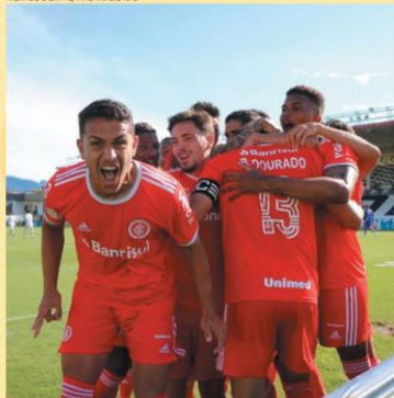
LIDER — Internacional mostrou sua força contra o Vasco