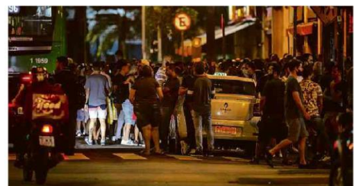
Aglomeração no Largo do Arouche, no centro de São Paulo, ontem à noite.

Três ministros de Jair Bolsonaro eram membros do Alto-Comando do Exército quando o então comandante, Eduardo Villas Bôas, postou sobre habeas corpus de Lula, em 2018. Vista como ameaça, a nota foi atenuada pelo titular da Defesa à época. Poder A6