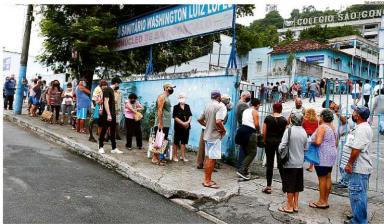
Esperança. Longa fila se forma para vacinação contra a Covid de idosos em São Gonçalo, Região Metropolitana do Rio; escassez deve aumentar nos próximos dias

Estoque vai para 2ª aplicação; Rio deve parar novas imunizações