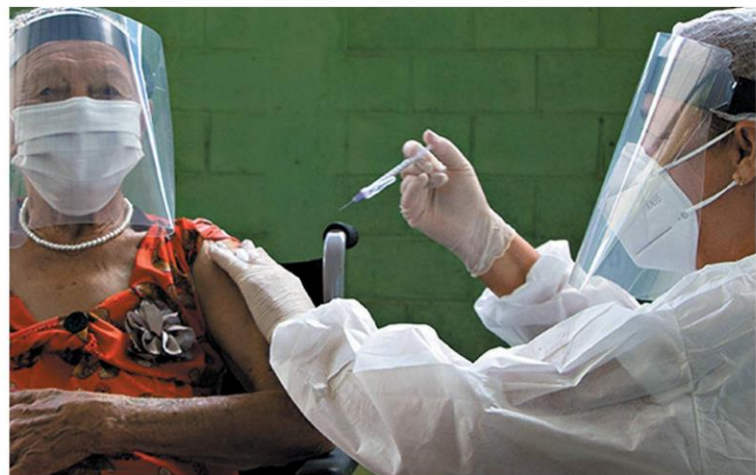
CHAMADO - Público prioritário deve ficar atento à documentação que terá de ser apresentada nos postos de saúde

Câmara dos Deputados aprovou ontem projeto de lei que cria um novo tipo de crime, a "infração a plano de imunização". Desrespeito à prioridade pode render até 3 anos de detenção. Proposta também enquadra quem se vale de cargo público para se beneficiar, prevendo pena quatro vezes maior. Texto ainda será analisado pelo Senado. HORIZONTES - P. 9