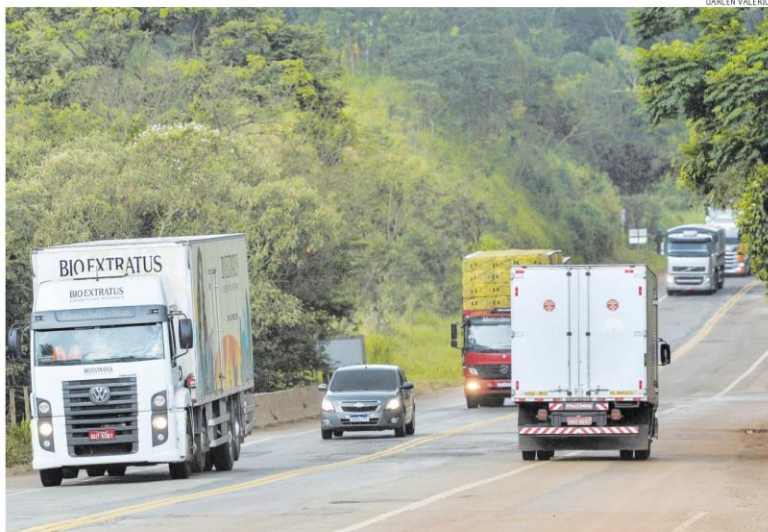
Rodovia. Trecho de obra da BR-381 entre Caeté e o trevo de Barão de Cocais; expectativa é de que edital saia até março

LICENÇAS. O senador disse ainda que o governo federal pode se responsabilizar pelas licenças ambientais, evitando assim atrasos nas