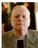
O empresário Larry Flynt em imagem de 2014.

Em disco, Gal Costa tenta buscar com parceiros algo de seu mestre, João Gilberto