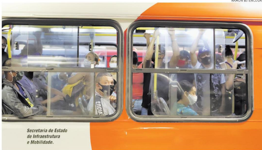
Secretaria de Estado de Infraestrutura e Mobilidade.

“O novo telefone para fazer a reclamação sobre o transporte coletivo metropolitano é o 162.