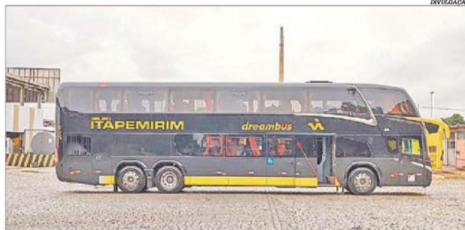
Empresa anunciou também que decidiu antecipar a operação de sua nova estrutura rodoviária

Assim, por meio da Viação Itapemirim, a companhia lançou o conceito Dream Bus. Com isso, os ônibus da linha Belo Horizonte-Brasília e Brasília-Belo Horizonte passam a