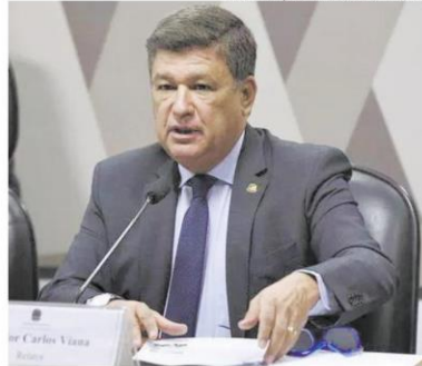
Viana se diz otimista em relação aos prazos para iniciar as obras

PELRO FRANÇA / AGÊNCIA SENADO - 20.3.2020