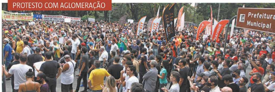
No contramão das medidas de distanciamento, representantes de diversos ramos do comércio - muitos sem máscaras de proteção - fizeram manifestação ontem, na porta da prefeitura, e fecharam a Afonso Pena

Estabelecimentos considerados não essenciais amanheceram de portas fechadas em Belo Horizonte ontem, em cumprimento ao decreto municipal publicado na sexta-feira que determinou o novo fechamento da cidade para conter a pandemia do novo coronavírus. O trânsito, no entanto, foi intenso nos principais corredores pela manhã, enquanto a fiscalização trabalhava para orientar os comerciantes e garantir o cumprimento da norma, que busca evitar o colapso do sistema de saúde na capital. Em outra frente, o secretário municipal de Saúde, Jackson Machado Pinto, anunciou ontem a abertura de 40 novos leitos de UTI para pacientes com COVID-19.