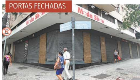
Em cumprimento ao decreto municipal publicado na sexta-feira, lojas suspenderam as atividades

Em dia de manifestação contra restrições ao comércio, capital registra recorde de ocupação nas UTIs