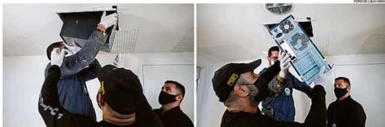
Policiais recolhem CPU de computador em contrada por acaso pelo pessoal da manutenção escondida em teto no andar onde ficava a Riotur na Cidade das Artes, apontada como o "QG da Propina" na gestão de Crivella. PÁGINA 11