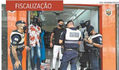
No Centro da cidade, homens da Guarda Municipal orientavam os lojistas a seguirem a determinação da PBH