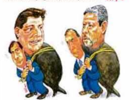
"E você, vai de Baleia ou delírio?"

Na Câmara, a pergunta que não quer calar: CHISPE