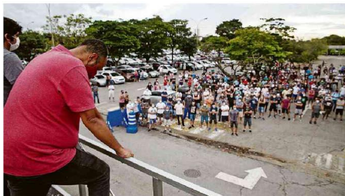
Sindicato realiza assembleia com metalúrgicos no estacionamento da unidade de Taubaté, ontem à tarde.

Toda informação Sobre jornalismo e livre difusão do pensamento.