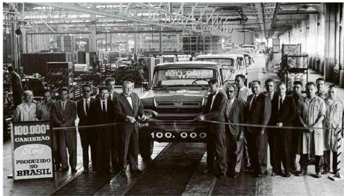
Ato comemorativo do 100.000º caminhão fabricado pela Ford no país, em abril de 1964, na fábrica de São Paulo.