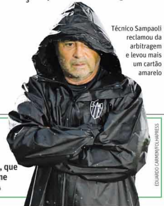
Técnico Sampaoli reclamou da arbitragem e levou mais um cartão amarelo

R$ 2,00 (outros Estados R$ 3,00) - www.otempo.com.br - Belo Horizonte - Ano 25 - Número 8795 - Terça-feira, 12/1/2021