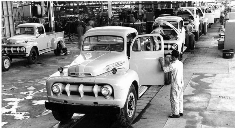
Fim de uma era. Linha de montagem de caminhões da Ford no Ipiranga, na década de 1960: ano a ano, marca vinha perdendo espaço para concorrentes

A montadora, primeira a se instalar no Brasil, em 1919, anunciou o fechamento de todas as suas fábricas