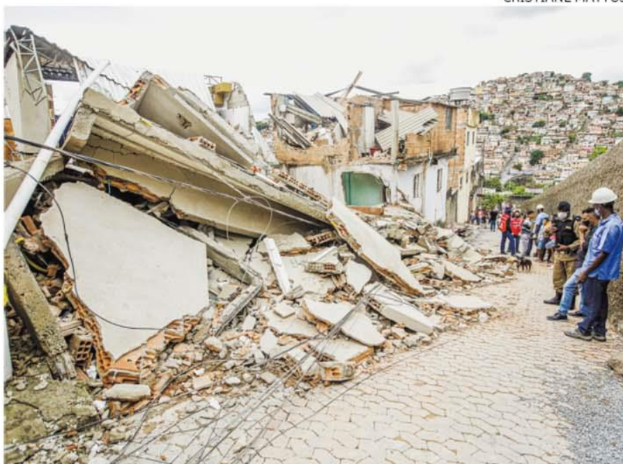
Edificação clandestina não resistiu à chuva do último domingo