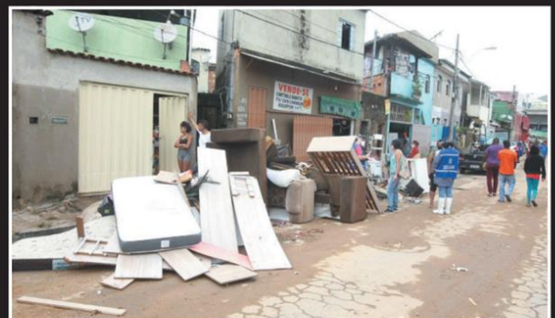
MUITAS PERDAS - Em vários bairros da cidade, moradores passaram a segunda-feira retirando entulhos e contabilizando prejuízos, muitos deles irreparáveis; houve protestos