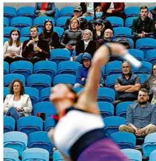
Com teto do estádio aberto, público acompanha partida sem utilizar máscara em Melbourne. A artista Brandon Retzky/Reuters

Heróis LGBT ganham espaço em games enquanto indústria explora 'pink money'