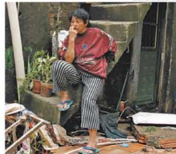
Deslizamento no Bairro Carlos Prates, na região em que mais choveu, foi a ocorrência de maiores proporções. Em outras áreas, como no Primeiro de Maio, foram inundações que levaram prejuízo a moradores