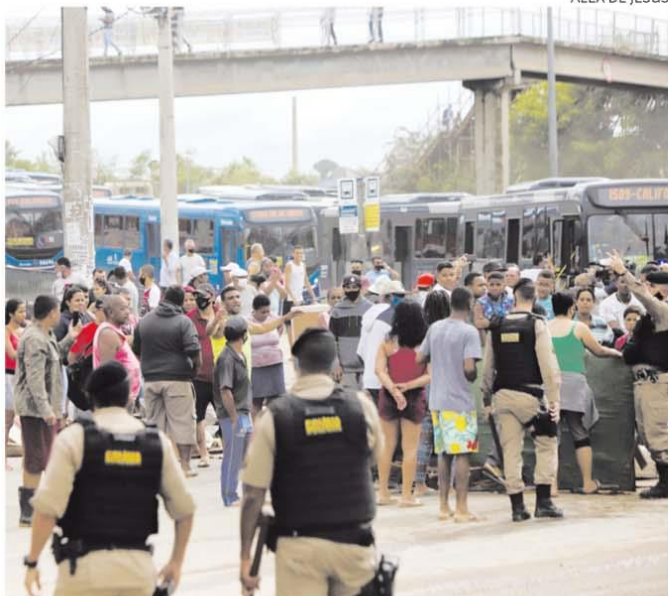
Manifestação dos moradores foi próxima da estação São Gabriel

Com pedaços de paus, camas, sofás e outros objetos, manifestantes interditaram ontem a avenida Cristiano Machado, perto da estação São Gabriel. O grupo cobrava um posicionamento da prefeitura após o temporal de domingo, que inundou e destruiu várias casas no bairro Primeiro de Maio.