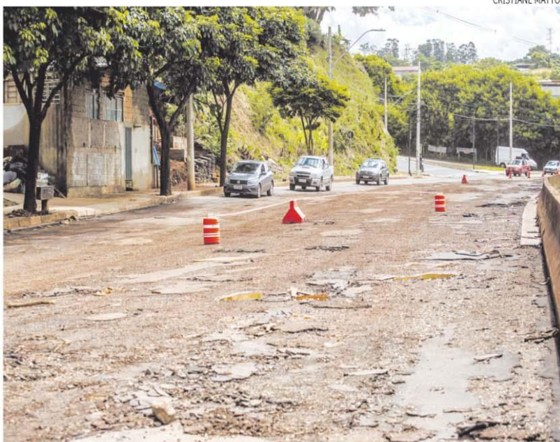
Lama e buracos. Avenida Tereza Cristina segue à espera de solução definitiva contra as inundações

COMITÊ CRIADO. A situação caótica da avenida Tereza Cristina no período chuvoso fez com que representantes da PBH, da Prefeitura de Contagem e do governo de Minas