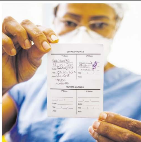
Imunizada. Primeira a ser vacinada no Estado recebeu ontem a segunda dose

para o ICMS sobre combustíveis, na sexta-feira, o presidente Bolsonaro afirmou que não vai interferir nem na empresa, nem nos Estados, alegando não ser um 'ditador'. Página 11