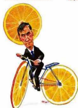
Laranjocicleta de resultados