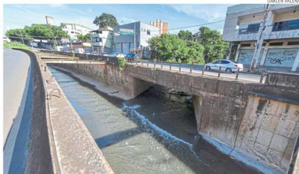
Ponto de encontro das águas do córrego do Ferrugem com o rio Arrudas, na avenida Tereza Cristina