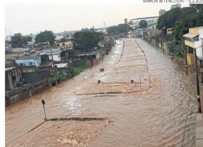
Transbordamento do rio causa medo e uma série de transtornos