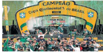
AL EX DE VALTER/STAFF

Menos de 40 dias após conquistar a Libertadores, o Palmeiras venceu a Copa do Brasil pela quarta vez ao bater o Grêmio ontem, em casa, por 2 a 0. Além dos dois troféus, a equipe alviverde chega ao fim da temporada de 2020 com a taça do Campeonato Paulista. Trata-se de uma "tríplice coroa" que ficará na história. ESPORTES / PÁG. A22