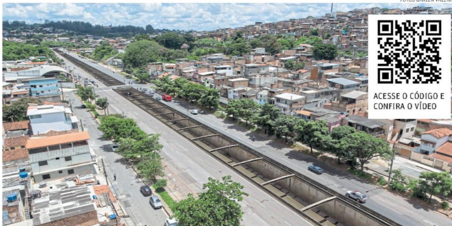
Rio Arrudas. Uma das principais vias da ligação entre Belo Horizonte e Contagem sofre há décadas com o problema dos alagamentos