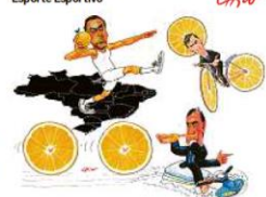
Refugolaranismo de resultados