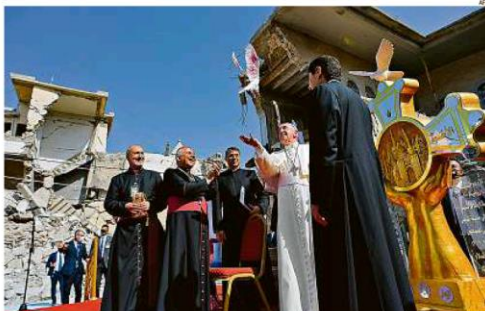
O Papa Francisco encerrou visita ao Iraque com missas em ruínas de igrejas cristãs destruídas em Mossul e Irbil. Ele rezou pelas vítimas do Estado Islâmico, expulso há três anos: "Não ao terrorismo e à instrumentalização da religião". PÁGINA 24