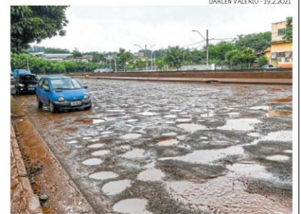
Asfalto da avenida após o último temporal, no início de fevereiro