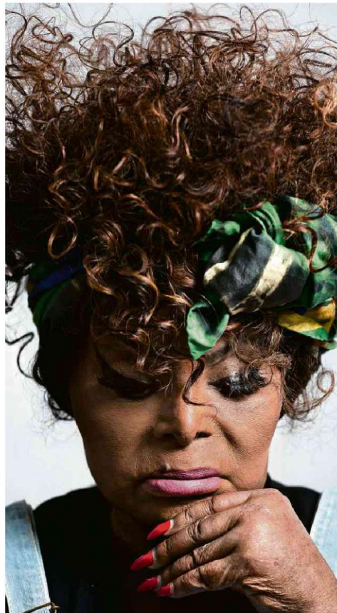
A intérprete Elza Soares, 90, em seu apartamento no Rio de Janeiro.