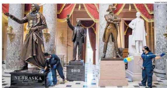
Faxina. Limpeza no Capitólio um dia após invasão de extremistas pró-Trump; confrontos deixaram 5 mortos

Governo Doria entende que não é o momento de aumentar o imposto sobre alimentos e remédios. PÁG. A3