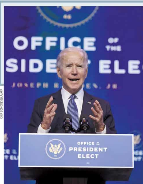
Joe Biden disse que invasão do Congresso foi “um dos dias mais sombrios”