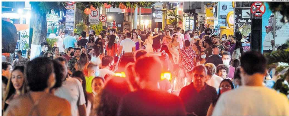
Negligência. Na Praia de Pipa, Rio Grande do Norte, turistas e moradores sem máscara se aglomeram em rua que concentra bares e restaurantes, ignorando medidas de segurança

O Brasil superou ontem a marca de 200 mil mortes pela covid-19, com uma curva ascendente de casos de infecção e óbitos e em meio ao abandono dos cuidados por parte da população e as aglomerações do fim de ano. Espe-