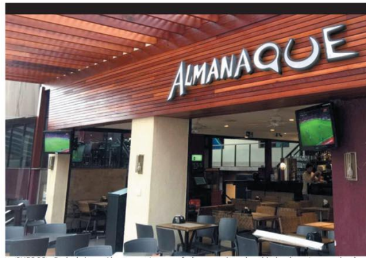
SUFOCO — Rede de bares Almanaque teve que fechar uma das seis unidades durante a pandemia