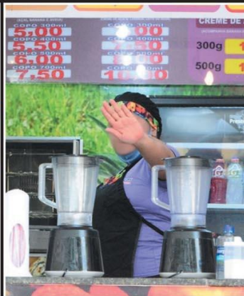
DESRESPEITO — Vendedores deixam máscara no queixo ou nem usam o acessório em diferentes pontos da capital; vários setores econômicos tentam negociar alternativa ao fechamento com a PBH