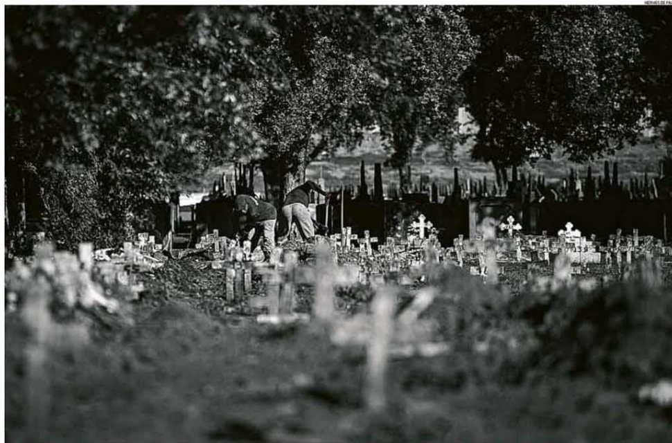
Rotina fúnebre. No Cemitério de São Francisco Xavier, no Caju, número de sepultamentos reflete situação da capital: com metade da população de São Paulo, Rio tem quase o mesmo número de óbitos, e escalada de mortes se agrava

social e ainda sem vacina, enquanto mais de 40 nações já começaram a imunizar seus cidadãos. Somos o segundo país em número de mortes no mundo, superando projeção do pior cenário, que era de 180 mil óbitos. Bolsonaro disse numa rede social: "A gente lamenta, mas a vida continua". PÁGINAS 8 A 10