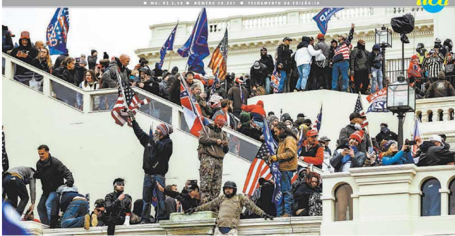
Apoiadores de Trump invadem o Congresso norte-americano, em Washington (DC). Desde as primeiras horas do dia, eles se organizavam para tentar impedir a confirmação da vitória do democrata Joe Biden nas eleições de novembro