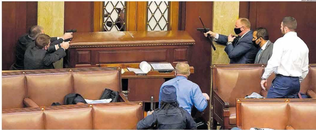
Tensão. Seguranças do Capitólio tentam impedir entrada de extremistas pró-Trump no plenário; invasão da sede do Legislativo foi considerada "violência sem precedentes" por Biden

● Insuflados por Trump, extremistas invadem Congresso americano e interrompem sessão de confirmação da eleição de Joe Biden ● Uma mulher, baleada dentro da sede do Legislativo, morre ● Ao cobrar Trump, Biden fala em insurreição