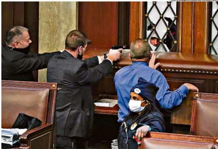
Alta tensão. Agentes da polícia legalizam o apontamento de armas na tentativa de impedir que manifestantes invadissem o plenário da Câmara. Sessão teve que ser suspensa

Em rede nacional, Biden cita agressão 'sem precedentes' e exige fim do cerco