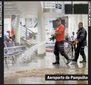
Aeroporto da Pampulha