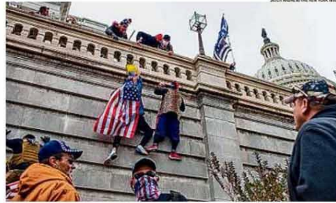
Vandalismo. Aceptos do presidente escalam muro do Capitólio durante sessão para referenciar vitória de Biden