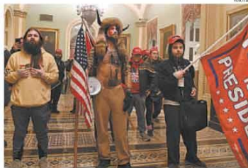
Fantasiados e usando adereços de apoio ao presidente, os manifestantes entram em confronto com a polícia e uma mulher morreu, depois de ser baleada

Uma multidão de apoiadores do presidente americano Donald Trump cercou e invadiu o Capitólio ontem para impedir a confirmação da eleição do democrata Joe Biden nas eleições presidenciais de novembro. Houve confronto e uma mulher morreu, depois de ser baleada. Ela seria uma militar veterana, com 14 anos de serviço para a Força Aérea, e estaria entre os manifestantes. Os invasores alegavam estar respondendo ao chamado do presidente para se manifestar. Com o caos instalado, Trump chegou a pedir que seus apoiadores fossem para casa, mas, em seguida, voltou a contestar os urnas e teve o seu conto no Twitter bloqueado por 12 horas. A sessão foi interrompida por horas e retomado à noite, com discursos veementes contra a invasão.