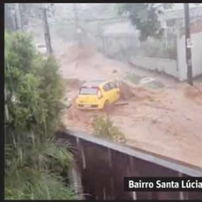
Bairro Santa Lúcia

Região metropolitana teve ao menos 250 raios, que provocaram queda de energia e incêndio; dezenas de árvores caíram e fecharam vias. Página 23