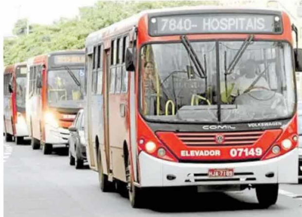
Pandemia impactou negativamente as finanças, dizem concessionárias