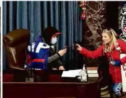
Após Trump concluir em discurso que manifestantes deveriam ir ao Congresso, multidão invade o Capitólio em Washington; agentes armados tentam colidir a entrada na Câmara (à esq.); invasor senta na cadeira do presidente do Senado (à dir).

A democracia americana sofreu ontem rachadura inédita em sua história recente, após apoiadores de Donald Trump invadirem o Congresso do país. Ação obrigou a Câmara e o Senado a trancarem suas portas e a paralisarem a sessão que deveria confirmar a vitória eleitoral de seu sucessor, Joe Biden. A invasão aconteceu poucos minutos depois de o próprio presidente americano, durante manifestação na capital do país, Washington, insultar os ativistas a se dirigirem até a sede do Legislativo. O Capitólio, então, virou cenário de caos. Uma mulher foi baleada e morreu, segundo a polícia. Formalistas foram trancados em um porão, pessoas fantasiadas de vikings confrontaram assessores, congressistas ficaram presos em seus gabinetes, agentes sacaram suas armas. Biden pediu que Trump tomasse uma atitude e fez críticas duras aos manifestantes. "Nossa democracia está sob ataque. Isso não é um protesto. É uma insurreição. Estou chocado e triste. É um momento sombrio. A América é muito melhor do que o que vimos hoje." Mundo A16 e A11