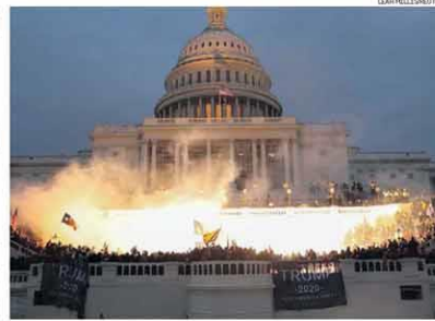
Caos. Artefato da polícia explode entre radicais que cercaram o Capitólio

bloqueadas temporariamente por incitar à violência, pediu manifestações pacíficas. O presidente Jair Bolsonaro reafirmou que as eleições nos EUA foram fraudadas. INTERNACIONAL / PÁGS. A13 e A16