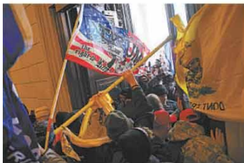
Com bandeiras nas mãos, os manifestantes invadiram o plenário do Capitólio para impedir a certificação da vitória da chapa Biden/Harris

...a democracia foi tão frontalmente atacada, com radicais insuflados pelo presidente Trump tentando impedir, à força, a confirmação do resultado das urnas e colocando em xeque os valores da nação