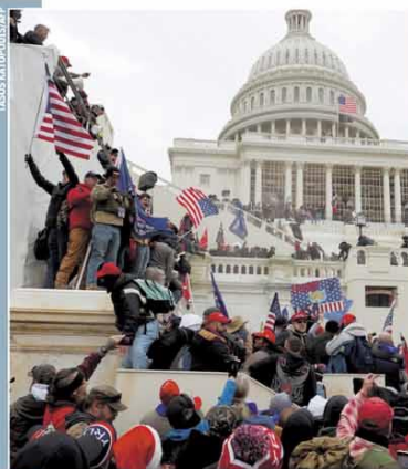
Fora. Milhares de manifestantes se reuniram no Capitólio

MINISTRO AFIRMA QUE PAÍS TEM 354 MILHÕES DE DOSES DE VACINA ASSEGURADAS. Página 10