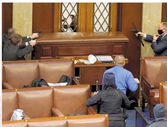
Dentro. Policiais do Congresso apontam armas para porta sob ataque dos extremistas invasores