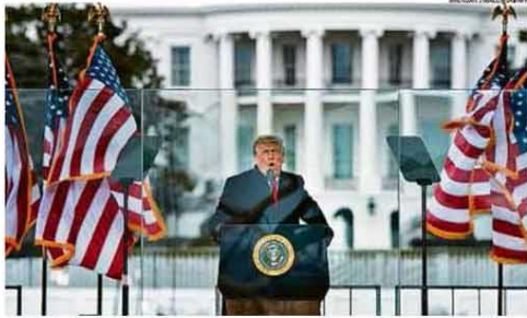
Na mesma tecla. Em discurso para apoiadores em frente à Casa Branca, Trump voltou a falar em fraude na eleição

RIO DE JANEIRO, QUINTA-FEIRA, 7 DE JANEIRO DE 2021 ANO XCIV - Nº 31.930 - PREÇO DESTA EXEMPLAR NO RJ - R$ 5,00