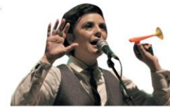
Pato Fu apresenta "Música de Brinquedo 2". Som é feito com saxofones de plástico, kazoos, piano e tecladinhos de R$1,99. Domingo, on-line. ALMANAQUE - P.23