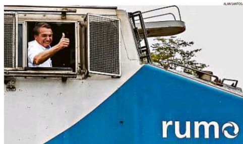
Na inauguração de trecho da Ferrovia Norte-Sul, em Goiás, Bolsonaro repetiu atitude tomada várias vezes na pandemia e criticou governadores e prefeitos que tentam conter o vírus. PÁGINA 11