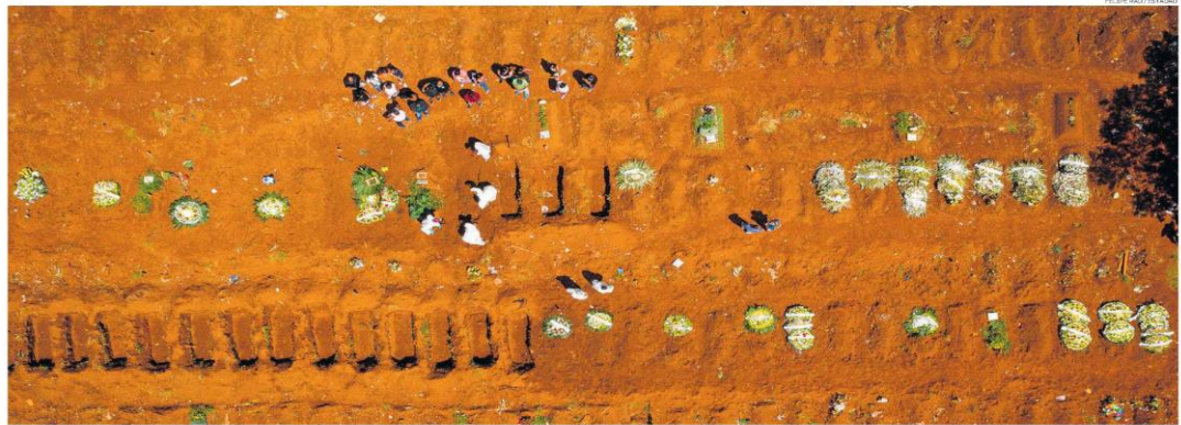
Rotina. Sepultamentos no cemitério Vila Formosa, na capital, que registra leve crescimento em enterros; funerárias constataam altas irregulares no interior do Estado e temem falta de caixões

• Infecções persistentes Para Akiko Iwasaki, da Universidade Yale, doentes há muito tempo podem espalhar as mutações. PÁG. A11