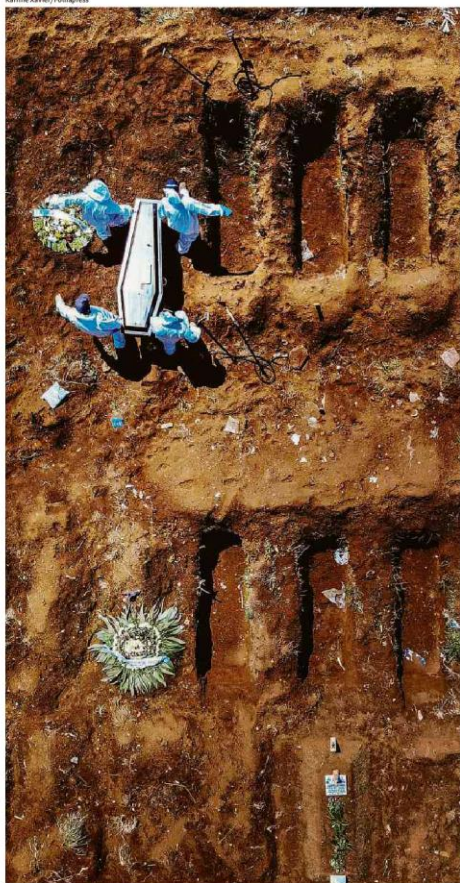
Sepultadores trabalham em covas abertas no cemitério de Vila Formosa, na capital paulista