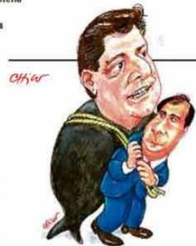
PT e Rodrigo Maia vão de Baleia na Câmara

Aprovada pelos acionistas, a união de Fiat Chrysler e Grupo PSA (Peugeot) deu origem à Stellantis, a quarta maior montadora do mundo e detentora de marcas como Jeep e Alfa Romeo. Fusão visa preparar a empresa para o desafio de avanços tecnológicos como o carro elétrico e o autônomo. PÁGINA 10