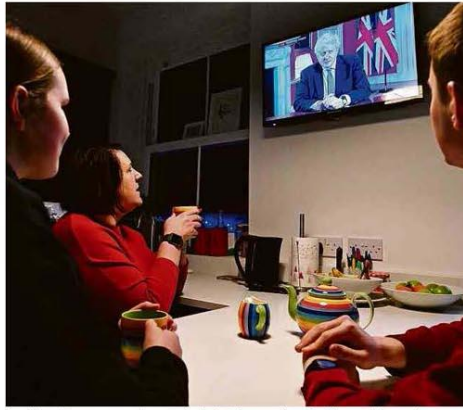
Família assiste ao pronunciamento de Boris Johnson sobre a Covid-19, em Liverpool.

Encerro minha colaboração com a Folha. Tentei aproveitar o espaço para comentar a agenda política de duas perspectivas diferentes: como observador de esquerda independente e como estudioso da polarização política e das mídias sociais. Opinião A2