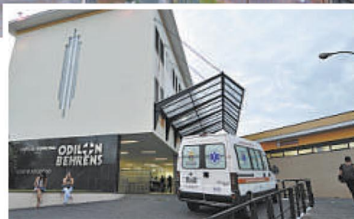
Fachada do Odilon Behrens: reconstrução da maternidade do hospital é um dos projetos na área de saúde