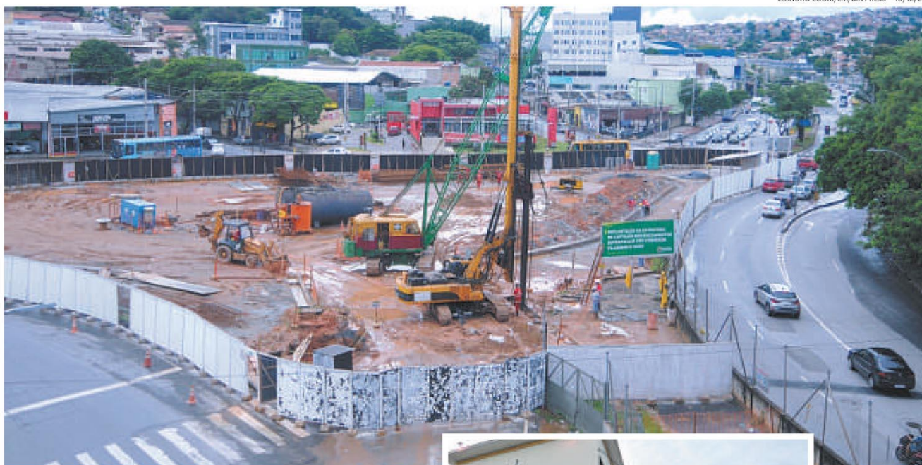
Segunda e terceira fases de obras na Vilarinho estão na lista e fazem parte dos projetos para evitar alagamentos no período das chuvas