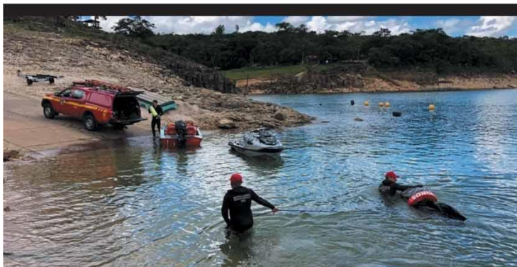
FIM DAS BUSCAS - Corpo de terceira vítima de "cabeça d'água" que surpreendeu turistas em cachoeira no último feriado foi encontrado em Capitólio. No sábado, 16 pessoas foram resgatadas com vida.

Sem previsão para retomar aulas presenciais e impactadas pela evasão de até 40% dos alunos em 2020, colégios terão reajuste médio de 0,6% a 0,7% este ano. Percentual adotado, quase seis vezes abaixo da inflação, e descontos que chegam a 30% tentam atrair quem cancelou matrícula devido à pandemia. PRIMEIRO PLANO - P.2