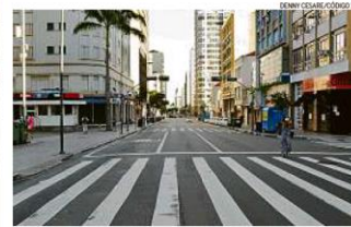
São Paulo. Campinas impôs fase vermelha antes mesmo da decisão estadual