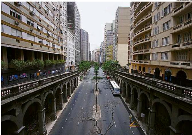
Rio Grande do Sul. A Avenida Borges de Medeiros, uma das principais de Porto Alegre, vazia. Atividades em público estão suspensas entre 20h e 5h no estado

de, Eduardo Pazuello, disse ontem que vai fechar a compra de 140 milhões de doses com a Pfizer, que entregaria 9 milhões de vacinas até junho, e com a Janssen. Especialistas reforçam a necessidade de isolamento social diante de um quadro crítico no país. PÁGINA 9