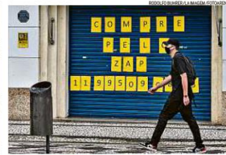
Paraná. Loja fechada em Curitiba, uma cena que se repete em todo o estado