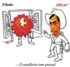
— O cavaleiro tem pressa?

MÍRIAM LEITÃO Ambiente recessivo continua em 2021 por falta de vacina PÁGINA 16