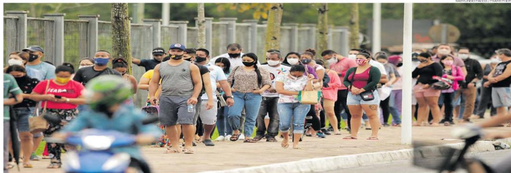
Betém. Fila formada ontem diante de hospital de campanha reservado para casos suspeitos de covid na capital paraense; maioria composta de jovens

Pelo quinto dia seguido, o País registrou ontem um recorde de mortes por covid-19 em 24 horas, com 1.840 óbitos. Com o agravamento da crise sanitária, o Ministério da Saúde diz ter acertado a compra de 99 milhões de doses da vacina da Pfizer e negocia a aquisição do imunizante da Janssen, após rejeitar durante meses propostas das duas empresas. METRÓPOLE / PÁG. A17