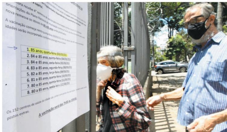
ALVINO - Em BH, idosos com 85 anos já estão sendo vacinados, e mais 285 mil doses do imunizante Coronavac chegaram ontem ao Estado