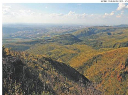
Parte do Serra do Rola Moça, porque que fica entre Belo Horizonte, Novo Lima e Brumadinho, seria afetado com a construção

Amda apresenta alternativa ao projeto do estado para obra que tenta desafogar o Anel Rodoviário de BH. Trecho é mais curto e teria impacto ambiental menor