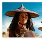
Cena da animação 'Raya e o Último Dragão'

Dados das 20h de 3 mar *Média móvel de 7 dias **Em relação a 14 dias