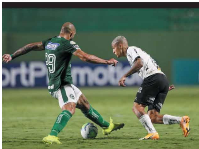
VACILOU! — Atlético volta a perder fora de casa no Brasileiro, desta vez para o Goiás