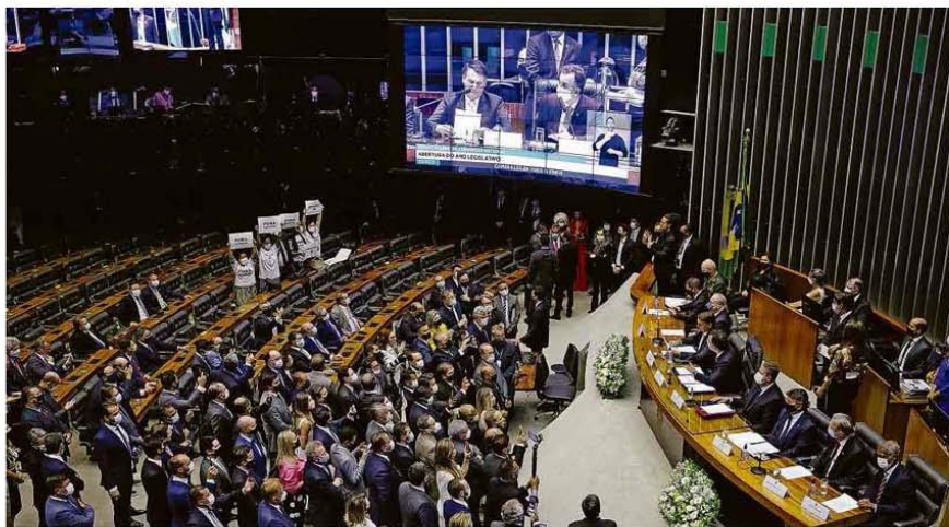
Parlamentares do PSOL protestam contra Jair Bolsonaro no momento em que ele inicia discurso na abertura do ano legislativo na Câmara.

Diálogos de membros da Lava Jato liberadas para a defesa de Luiz Inácio Lula da Silva serão usadas para reforçar seu pedido de habeas corpus, mas também criam expectativa sobre a revisão de dezenas de outros processos. Poder A6