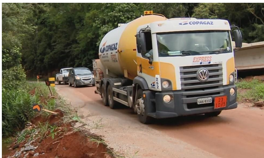
Motoristas desrespeitam sinalização e se arriscam em desvio na BR-460, em São Lourenço

Ainda segundo o DER, a obra definitiva ficará para depois do período chuvoso. O órgão segue monitorando a ponte.