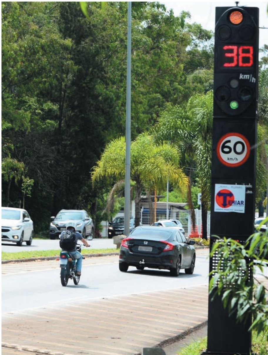
ONDE – MG-30, que liga BH a Nova Lima, deve receber mais radares em 2021; atualmente, por lá, já são seis equipamentos em operação

A expectativa do DER é, no primeiro trimestre deste ano, trocar os blocos de papel por um aplicativo para anotar as infrações cometidas pelos motoristas. A ideia é agilizar o trabalho do agente, que já irá fazer a notificação e transmiti-la de forma on-line