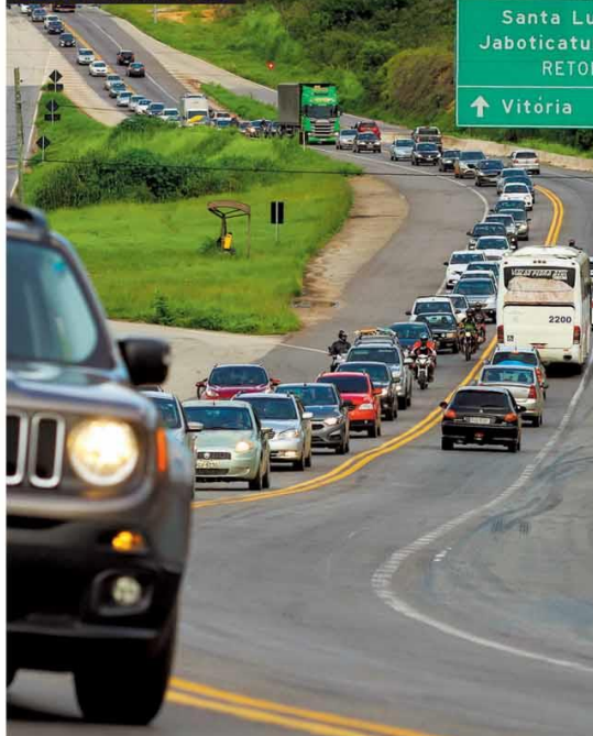
O fim do feriado foi de movimento intenso nas rodovias, como na BR-381, próximo a Sabará (foto). Na BR-267, uma mulher morreu após o carro em que estava cair no rio. Página 21