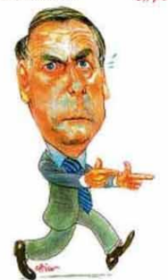
— Estão olhando o quê?