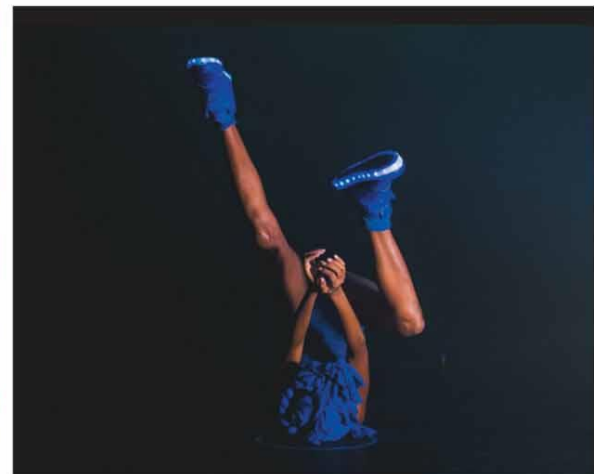
NOIR BLUE

PALMAS Produções mineiras estão no topo do ranking de curtas e médias-metragens mais citados em pesquisa do site Cine Festivais. NoirBLUE é um deles. ALMANAQUE - P.12