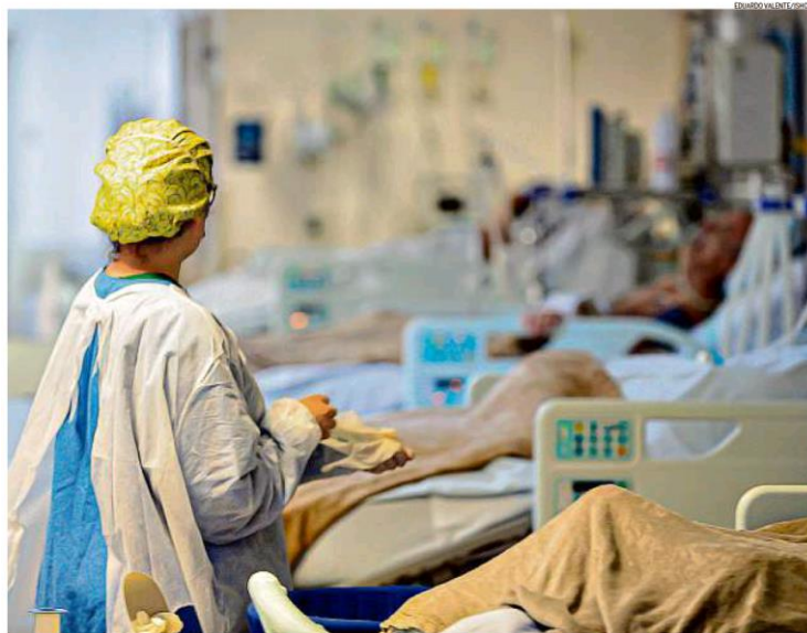
Sem opção. Hospital Florianópolis, referência no tratamento da Covid na capital de Santa Catarina, não tem vagas. Em 17 estados e no DF, ocupação de leitos de UTI ultrapassa 80%