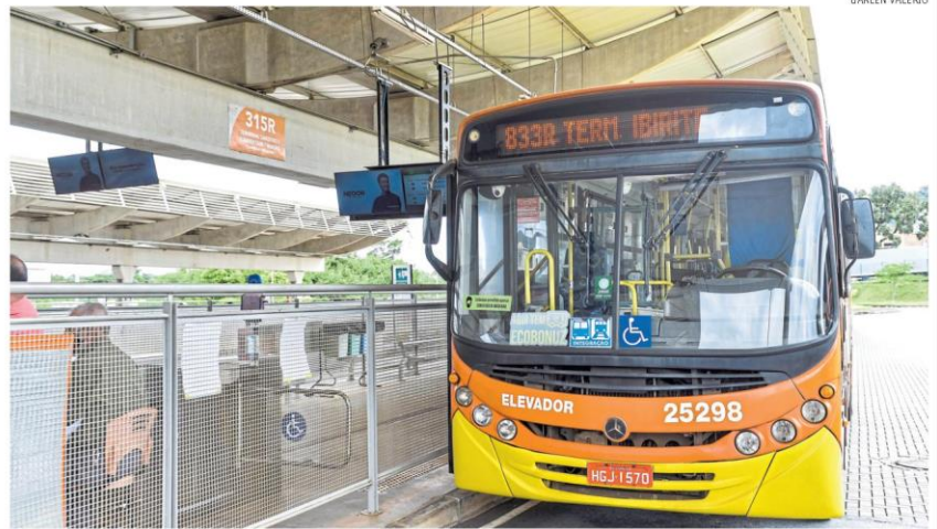
Novidade. Nova linha 833R começou a circular ontem e levará usuários para viagens entre os terminais rodoviários de Ibirité e Sarzedo

“O que a secretaria tem feito é dialogar, não só com nossos concessionários, mas também com as prefeituras, porque, no fim das contas, para o usuário não importa se o transporte é metropolitano ou municipal, o que importa é ter um transporte de qualidade”, concluiu.