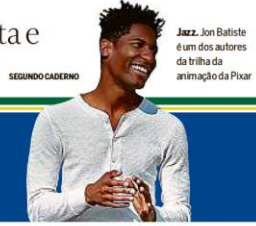
Jazz. Jon Batiste é um dos autores da trilha da animação da Pixar

Globo de Ouro: Premiado por 'Soul', o pianista e arranjador Jon Batiste fala da paixão pela MPB