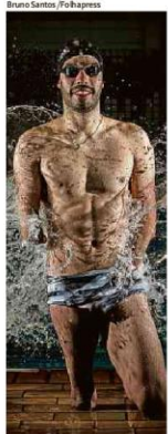
Daniel Dias, maior campeão da natação paraolímpica