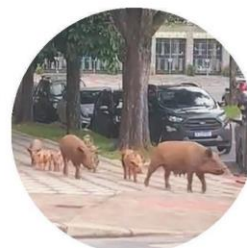
Moradores flagraram o passeio de uma família de porcos pelo bairro São Bento, em BH, no domingo. Confira o rolê que viralizou na web no hojeemdia.com.br.