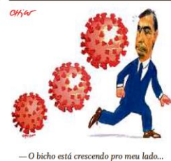
— O bicho está crescendo pro meu lado...

Ex-presidente da França deixa o tribunal onde ouviu a sentença de três anos de detenção por subornar juiz. Em vez de ser preso, ele deverá usar tornozeleira eletrônica. PÁGINA 19