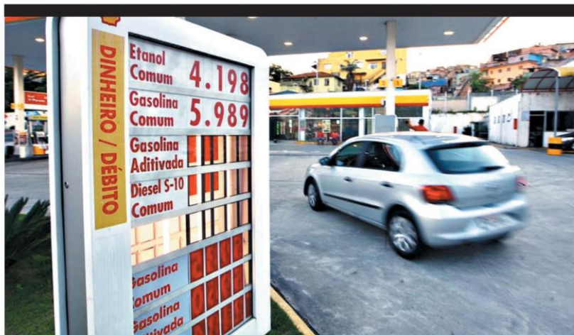
SUSTO – Preço médio da gasolina nas bombas saltou de R$ 4,48, em novembro, para R$ 5,30, no fim de fevereiro; em alguns postos, é até maior