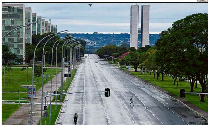
Tudo de novo. A Esplanada dos Ministérios deserta no domingo, depois que o governo do Distrito Federal adotou medidas para restringir a circulação de pessoas e limitar contágio

RIO DE JANEIRO, SEGUNDA-FEIRA, 1 DE MARÇO DE 2021 ANO XLVI - Nº 31.983 - PREÇO DESTA EXEMPLAR NO RJ - R$ 5,00 2ª EDIÇÃO