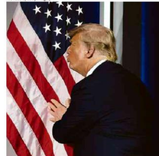
Trump beija a bandeira americana em evento na Flórida