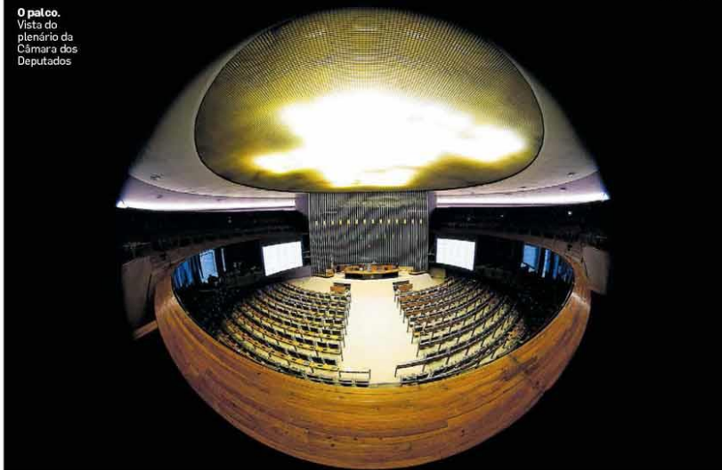
O palco. Vista do plenário da Câmara dos Deputados

*BASEADO NOS COMARCADOS DE EMPRESAS. †FONTE: MEN DA SAÚDE