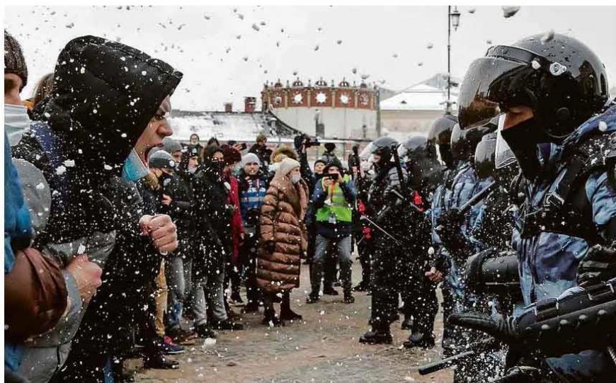
Sob neve e frio abaixo de zero grau, manifestante em Moscou grita com policial em ato pró-Navalni no centro da capital russa.

As eleições desta segunda (1º) no Congresso podem recolocar o centrão no comando da Câmara dos Deputados e em situação favorável no Senado. O agrupamento de siglas de centro-direita passou a ser o sustentáculo do governo de Jair Bolsonaro. Na Câmara, o favorito é Arthur Lira (PP-AL), candidato do presidente e líder do centrão. Ele enfrenta Baleia Rossi (MDB-SP), nome do atual chefe da Casa, Rodrigo Maia (DEM-RJ). No Senado, o DEM do atual presidente Davi Alcolumbre (AP) é favorito com Rodrigo Pacheco (MG). Mesmo sem ser do centrão, o partido naquela Casa está próximo do grupo e Pacheco é o candidato do Planalto. Em troca de um apoio seguro contra o impeachment, Bolsonaro promete cargos para seus novos aliados, que estiveram com Dilma Rousseff (PT) até abandoná-la. Ele foi eleito com um discurso de forte crítica ao centrão. Poder A4