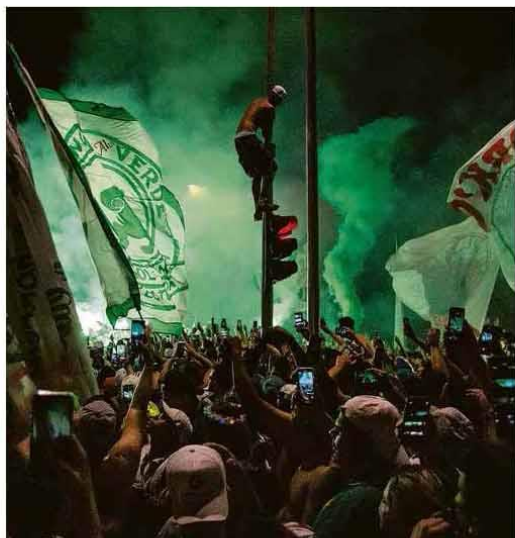
TORCEDORES RECEBEM PALMEIRAS COM AGLOMERAÇÃO Campeão da Libertadores, time foi celebrado por mais de mil pessoas ao chegar ao centro de treinamento da Barra Funda; com a vitória, clube aumenta maratona de jogos. Esporte B6 e B7

No segundo fim de semana com protestos em favor da libertação do líder opositor Alexei Navalni, mais de 5.100 russos foram presos em 87 cidades do país. Navalni está detido desde que voltou a Moscou de Berlim, após ter sido envenenado, e será julgado na terça-feira. Mundo A12