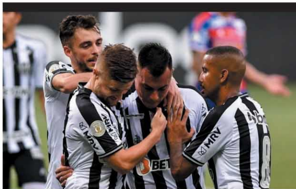
NOVO VICE — Atlético chegou aos 60 pontos e segue na briga pelo título do Brasileiro