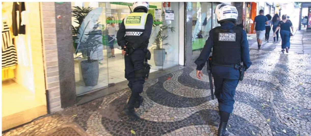
PATRULHA NAS RUAS — Agentes da Guarda Municipal irão fiscalizar o uso de máscara de proteção, aglomerações nas lojas e a venda de bebida alcoólica após 15h